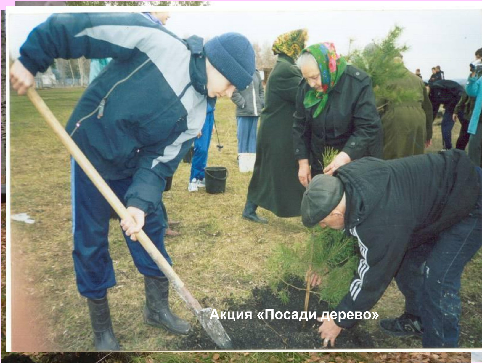
Акция «Посади дерево»