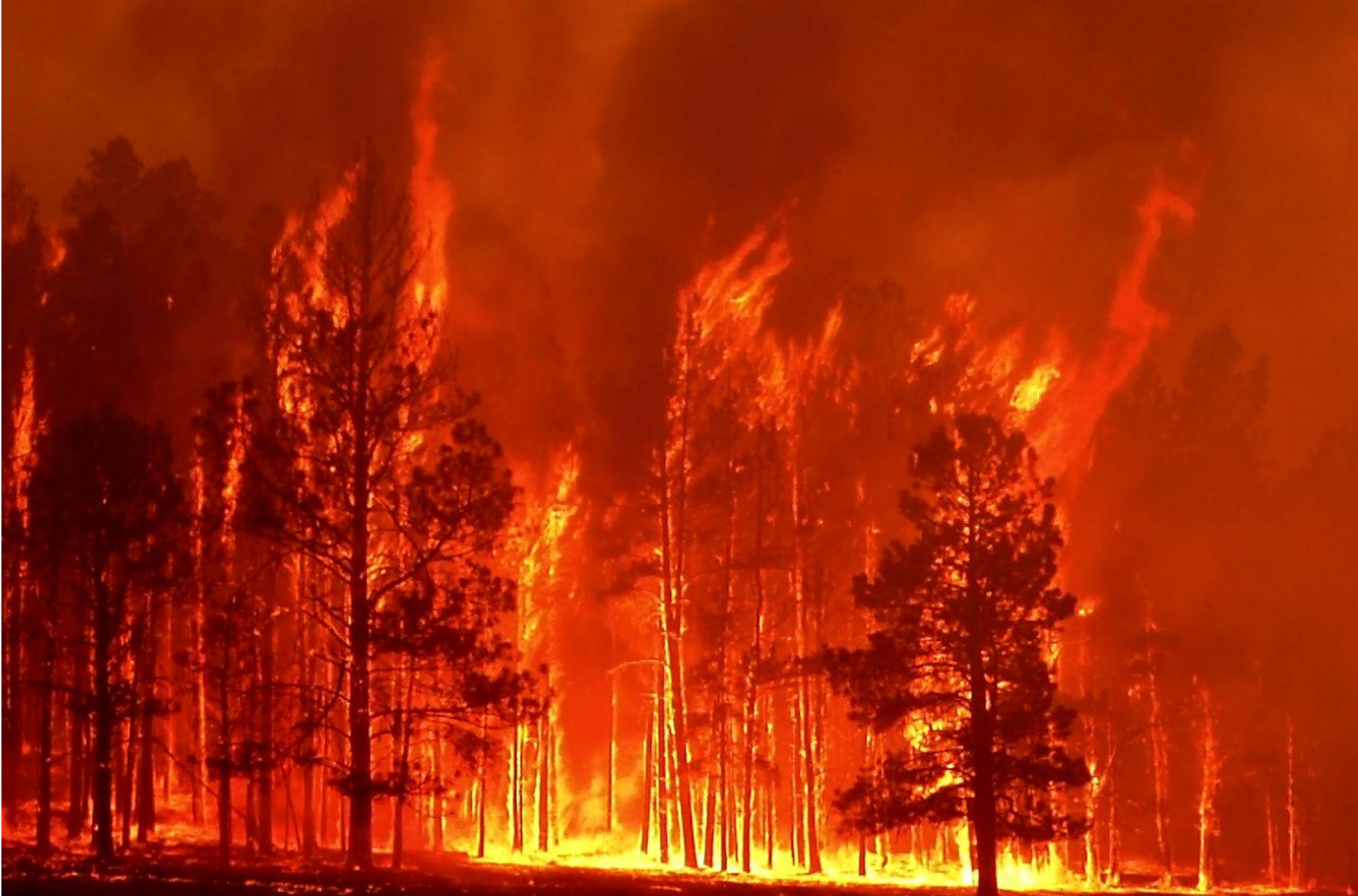
Мог бы сгореть весь лес...