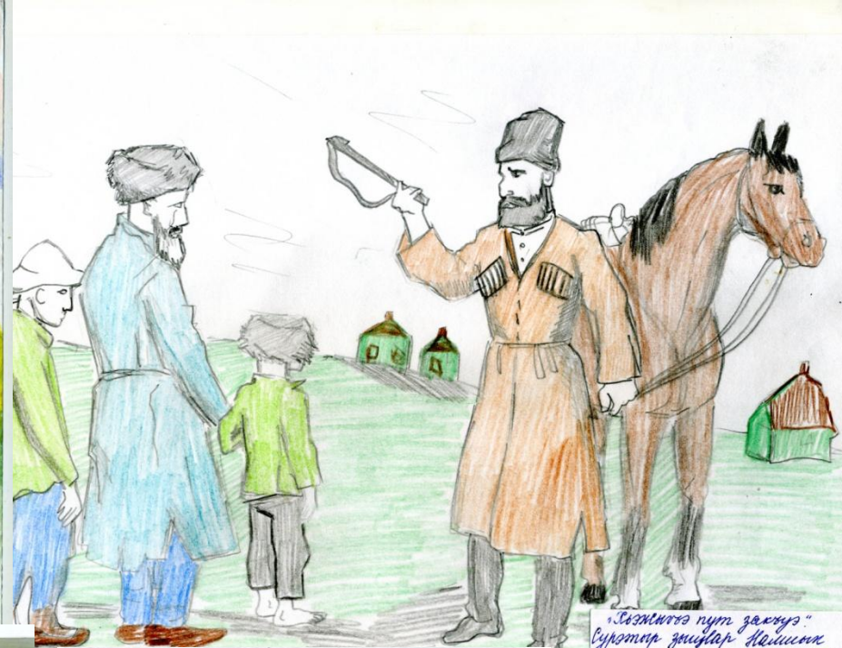
"Сезимтоо пүт даңуз" Сурактар динбар Нейимов Кызга дөт 31-чө күнөт сунса пөдө 6-чө 5-класстан илдетте Чоңо Тилишурд.