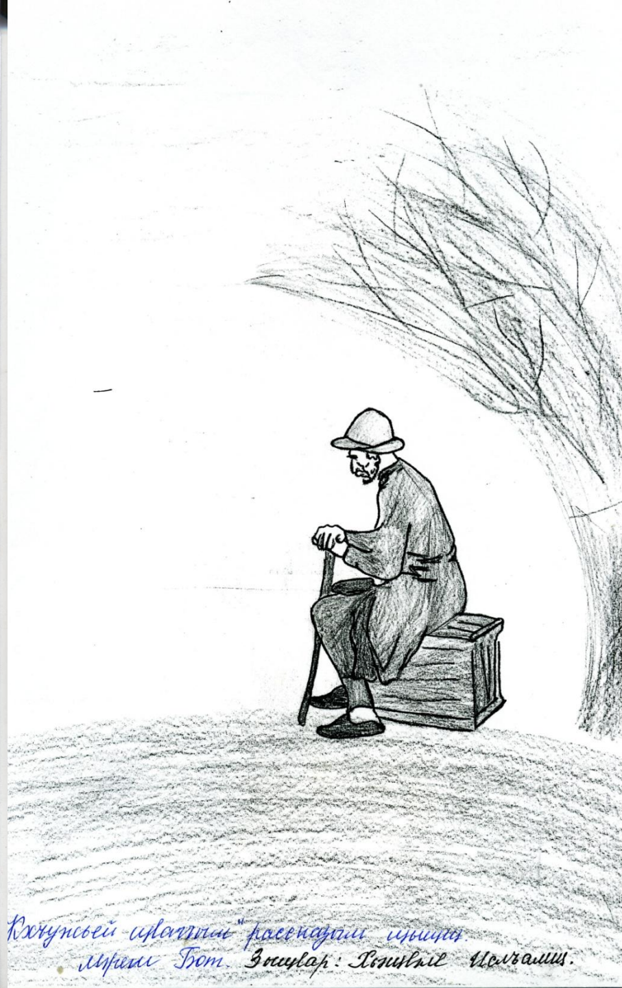
Къхунсвей ирэггын "расекадан ирэггын" иридэ Том. Зыщлар: Пондлэл Мелъамилл.