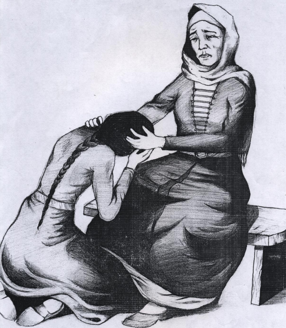
Щоджэнцыкту Алий «Мадинэ». Сурэтыр зыщлар Лъхукъуэщауэ Тимуриш, Налшык МОУ СОШ №11 и 10 «А» классым и еджаклуэщ.