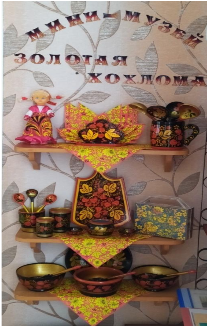
МИНИ-МУЗЕЙ «Золотая хохлома»