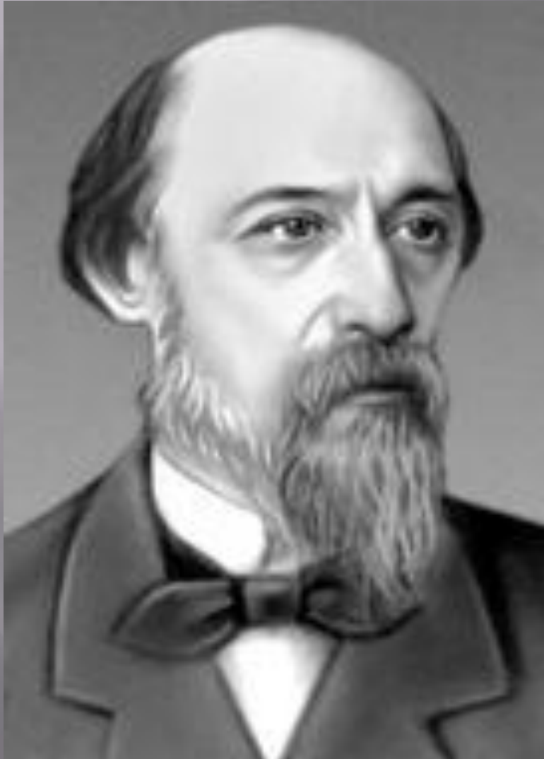
Николай Алексеевич Некрасов