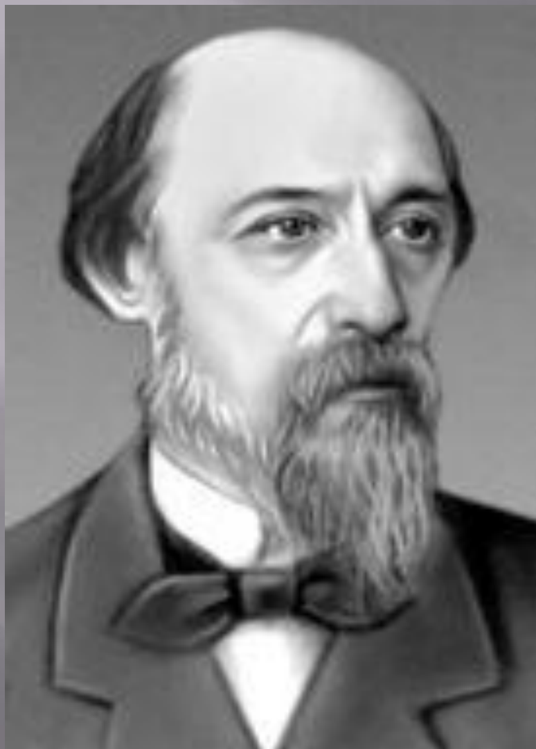
Николай Алексеевич Некрасов