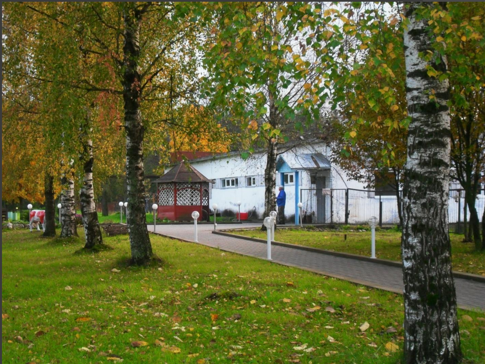
Сентябрь 2016 года. Территория СПК «Будогощь»