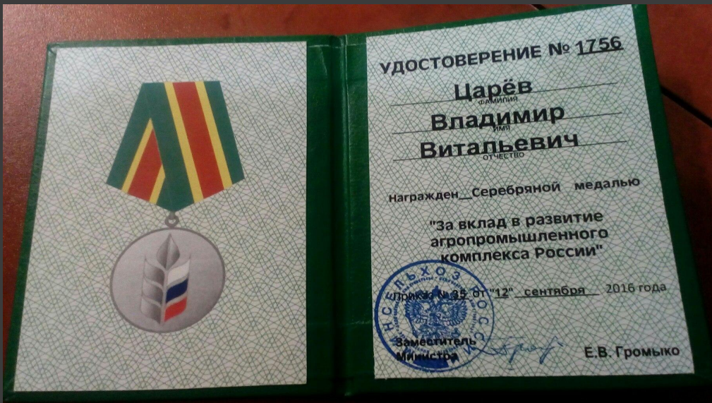
Серебряная медаль «За вклад в развитие агропромышленного комплекса России» и награда «Лучший руководитель сельскохозяйственного предприятия ленинградской области