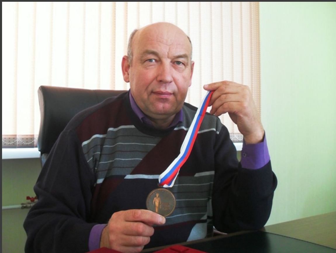
Медаль «Человек слова и дела» 2005 год