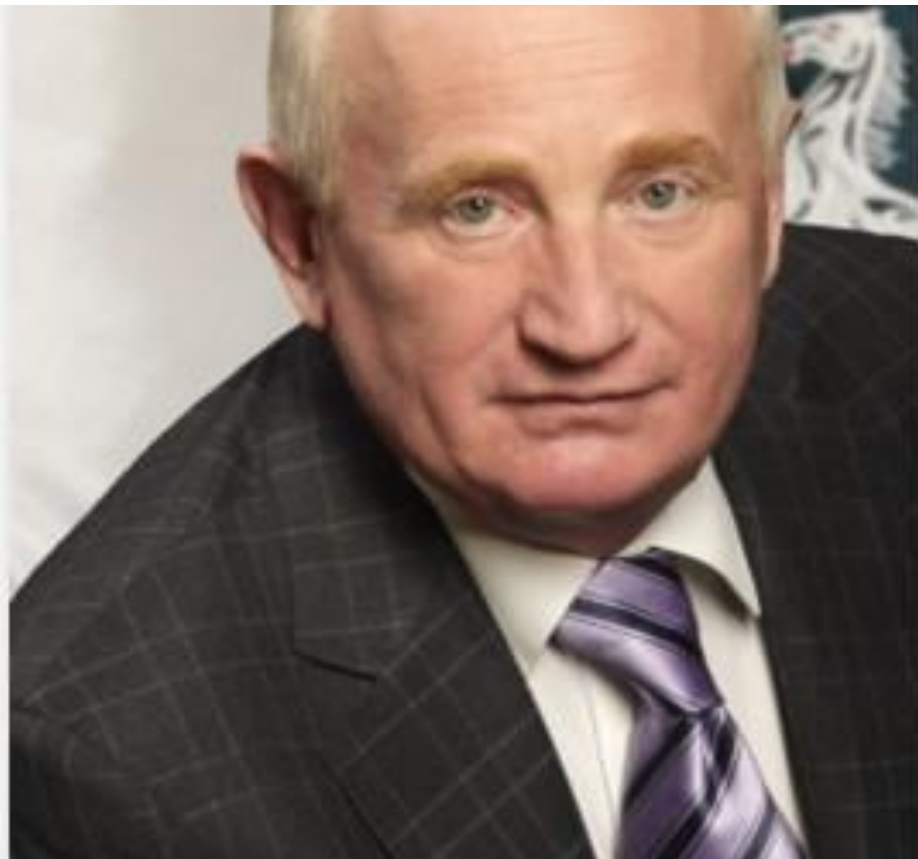
В.М. Кресс, Губернатор Томской области (1991–2012 гг.)

Многие социально-экономические проблемы Сибири возникли не сегодня и не вчера, поэтому для их решения необходимо учитывать долгосрочные тенденции в развитии региона.