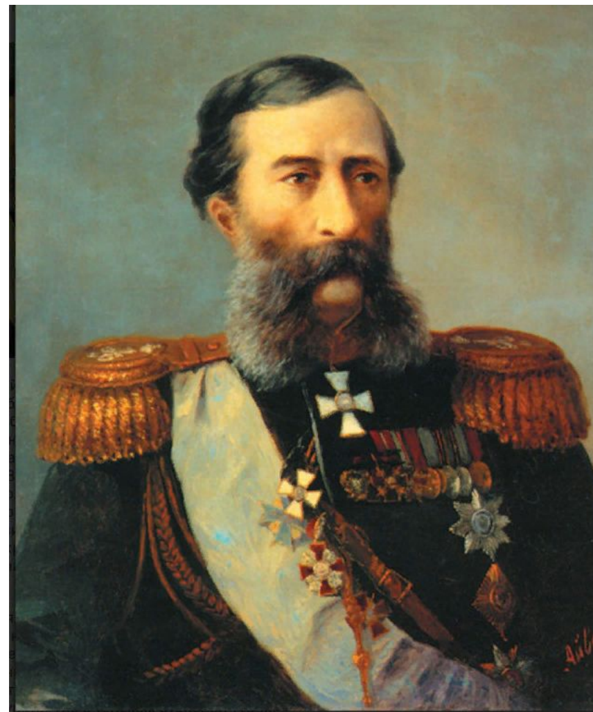
Михаил Таризлович Лорис-Меликов