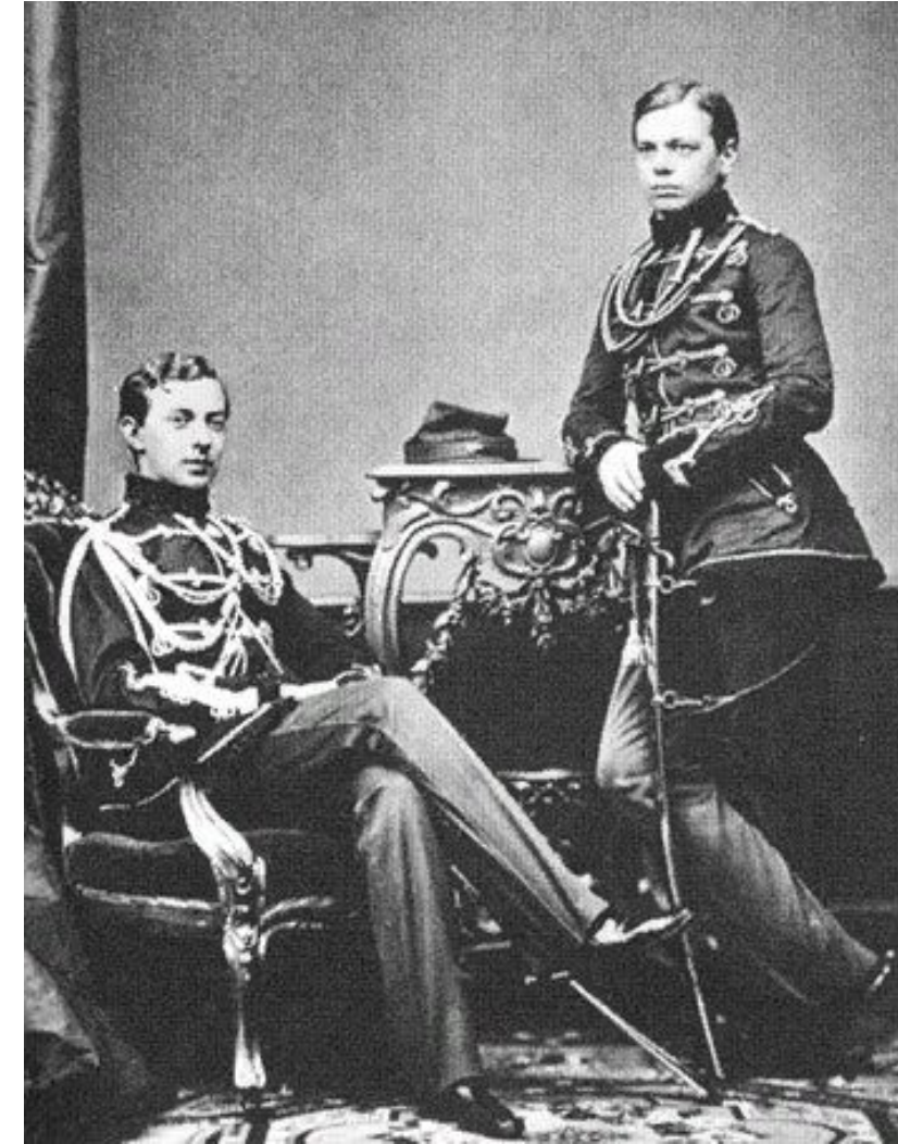
Николай Александрович и Александр Александрович Романовы