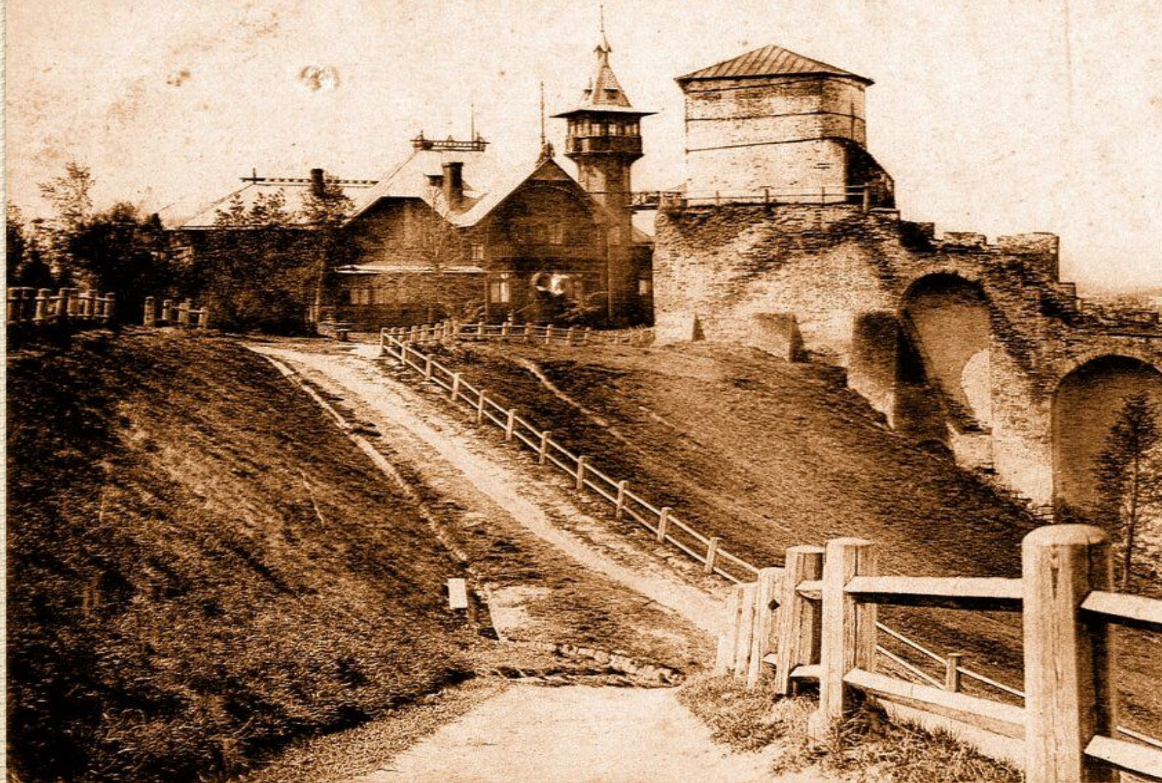
Нижній-Новгородъ. — Nijni-Novgorod. № 42. Кремлевскій элеваторъ, башня и ярмарка.