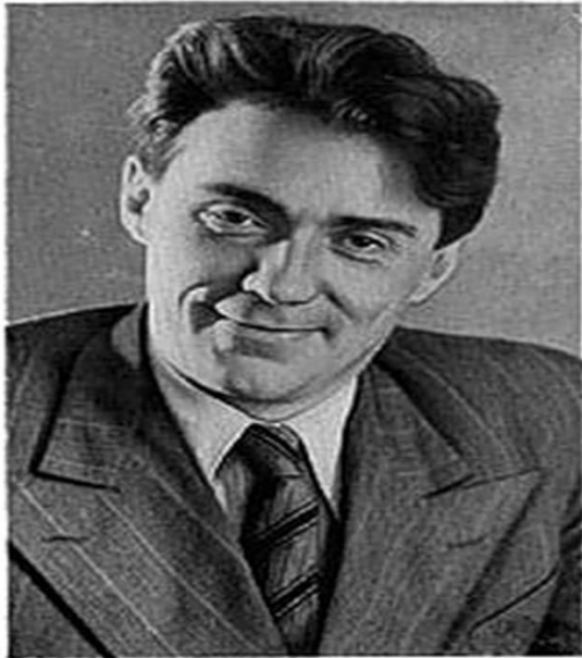
Борис Николаевич ПОЛЕВОЙ