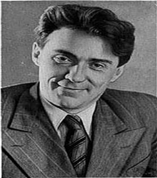
Борис Николаевич ПОЛЕВОЙ