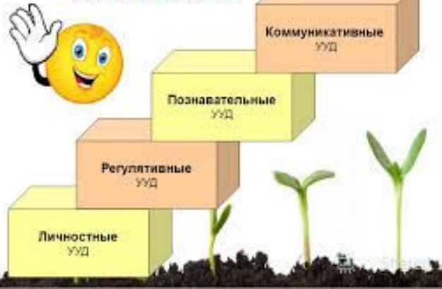
Виды универсальных учебных действий