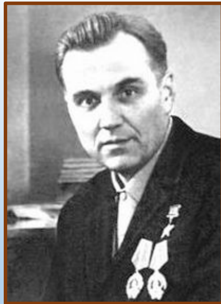
Василий Александрович Сухомлинский

«Урок – это зеркало общей и педагогической культуры учителя, мерило его интеллектуального богатства, показатель его кругозора, эрудиции.»