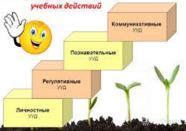
Виды универсальных учебных действий