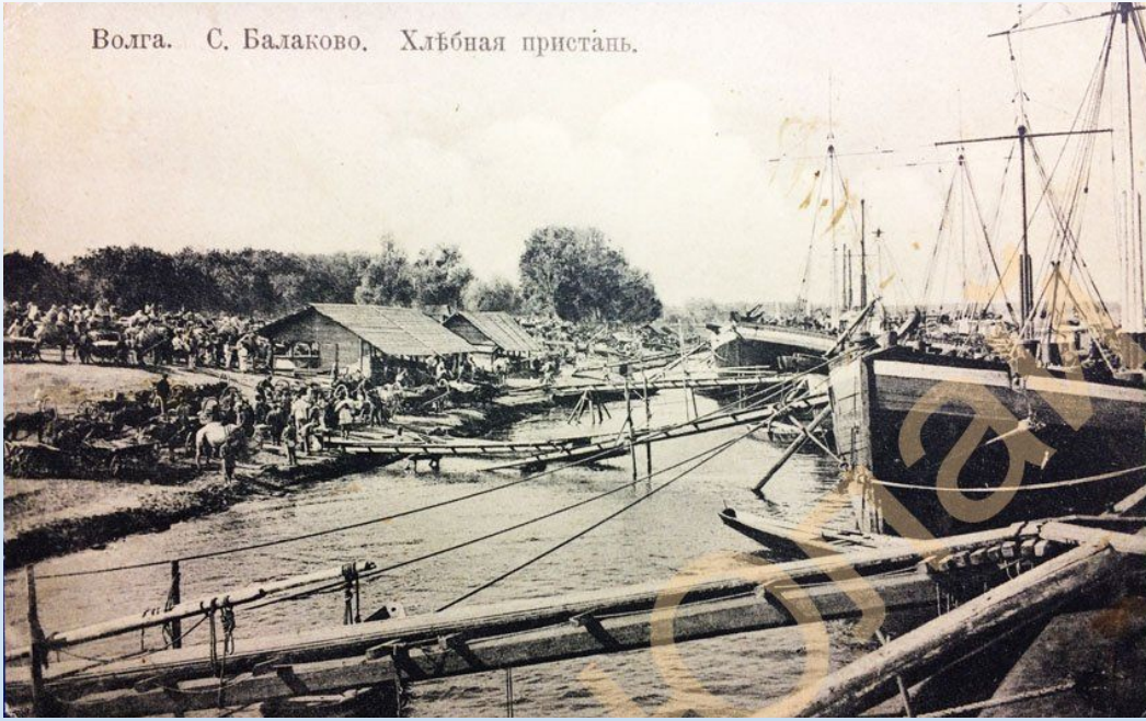
Волга. С. Балаково. Хлебная пристань.