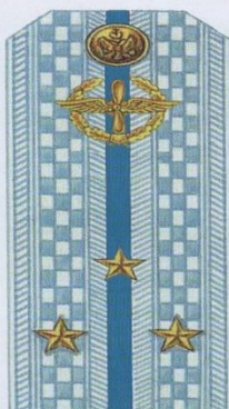
Старший лейтенант (парадная форма одежды, ВВС)