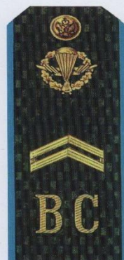
Младший сержант (ВДВ)