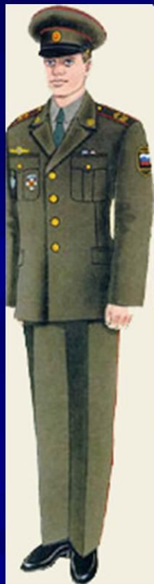
парадная вне строя