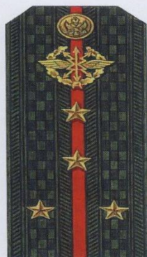
Капитан (повседневная форма одежды)