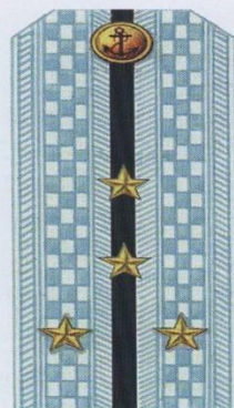
Капитан-лейтенант (парадная форма одежды, ВМФ)