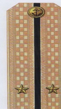
Лейтенант (повседневная форма одежды, ВМФ)