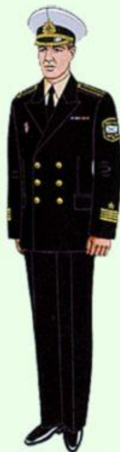
Повседневная вне строя