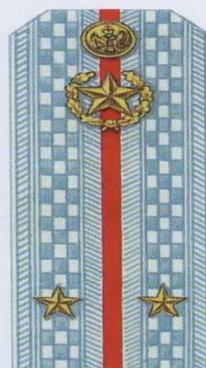
Лейтенант (парадная форма одежды)