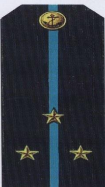
Старший лейтенант (повседневная форма одежды, морская авиация)