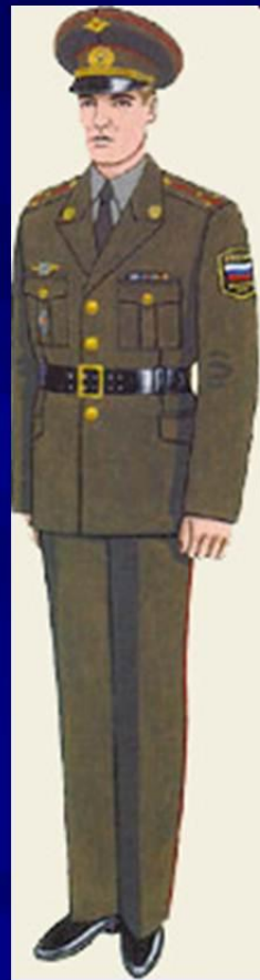
Повседневная для строя