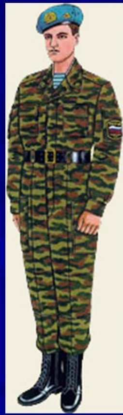
парадная для строя повседневная и вне строя ВДВ