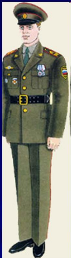
парадная для строя