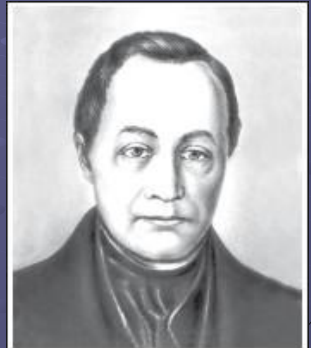
Огюст Конт 1798 – 1857