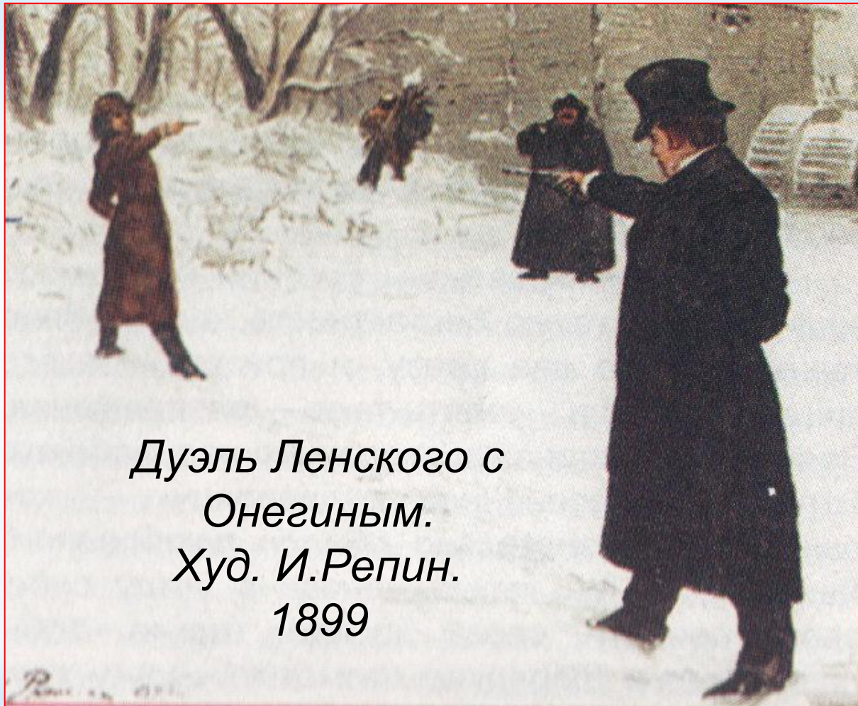
Дуэль Ленского с Онегиным. Худ. И.Репин. 1899