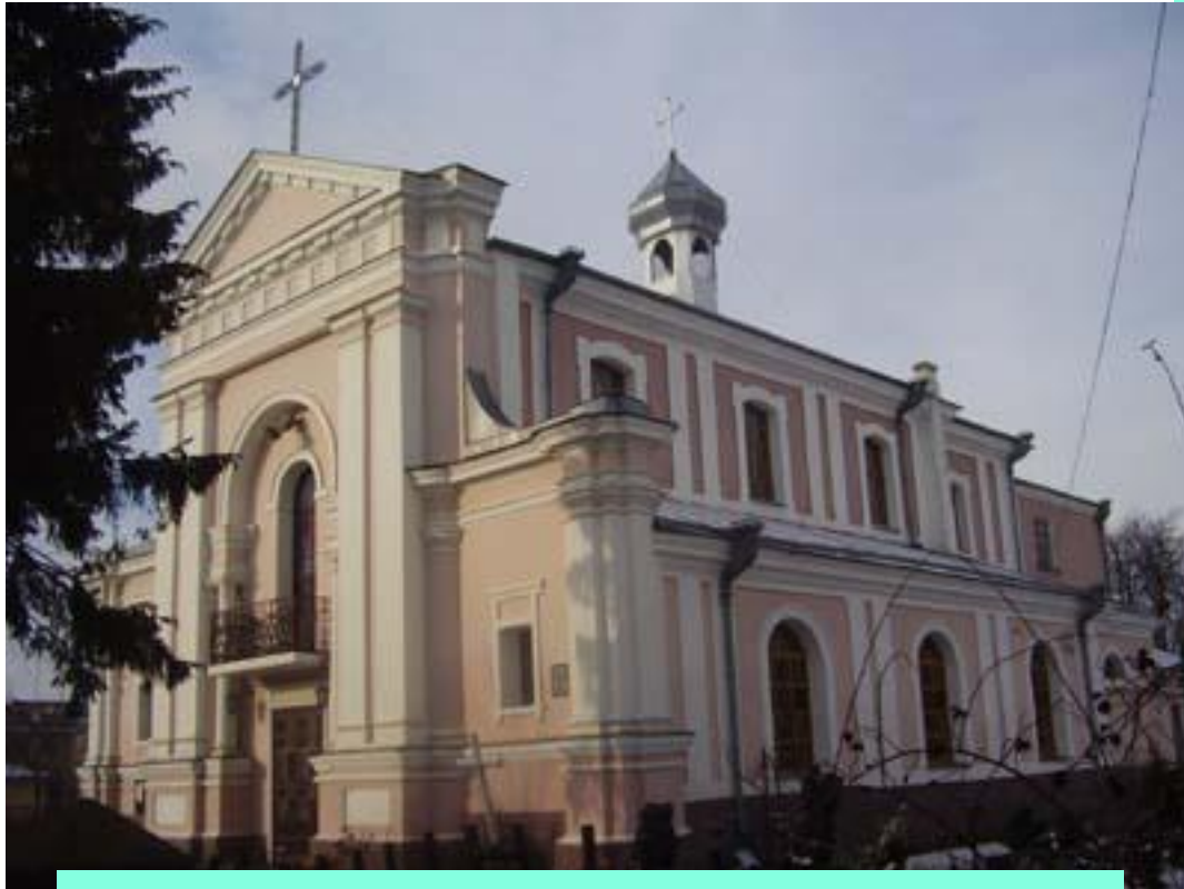
Костьол Святої Варвари міста Бердичів

У 1850 році одружився з Евеліною Ганською.