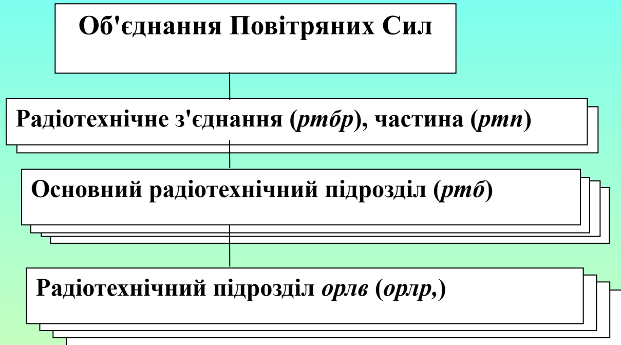
Рис. 1. Структура радіотехнічних військ