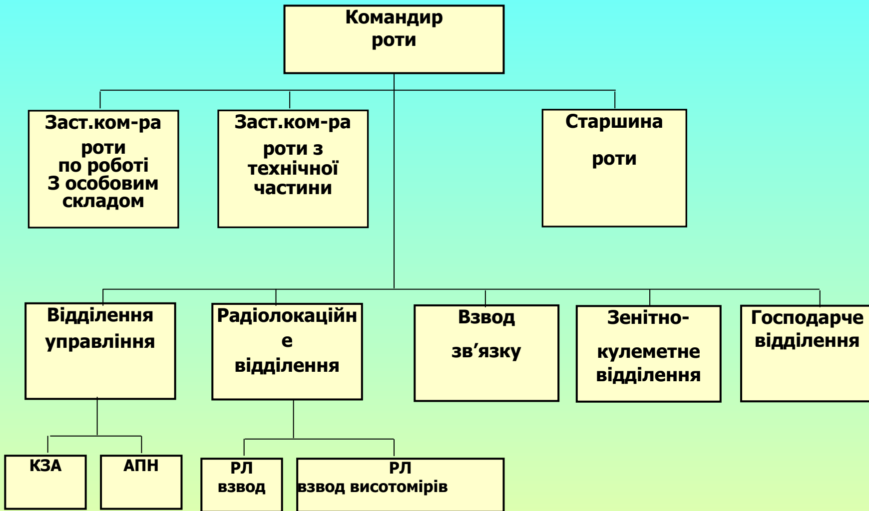
Рис.4. Організаційна структура рлр