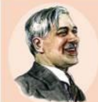
КОРНЕЙ ИВАНОВИЧ ЧУКОВСКИЙ

Книги Корнея Ивановича Чуковского весёлые, умные, а главное — добрые. Они учат дружбе, товариществу. Писатель уверен в том, что если нужно помочь другу, то никто и никогда не должен бояться никаких опасностей. Но уж если встретится кто-то злой или глупый, то у писателя находится для него непобедимое, верное средство — смех.