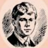
СЕРГЕЙ АЛЕКСАНДРОВИЧ ЕСЕНИН