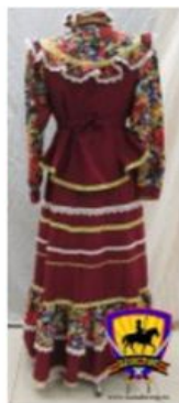
Костюм женский праздничный "Парочка" цвет бордо