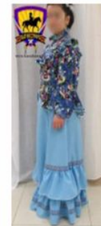
Костюм женский праздничный "Парочка" цвет лазоревый