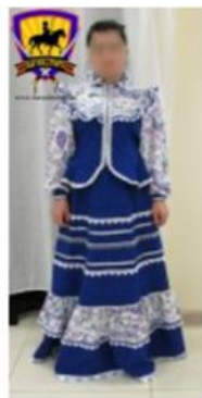
Костюм женский праздничный "Парочка" цвет василек