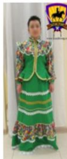
Костюм женский праздничный "Парочка" цвет зеленый