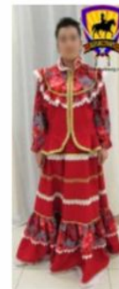
Костюм женский праздничный "Парочка" цвет красный