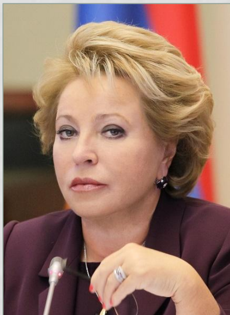
Валентина Ивановна Матвиенко