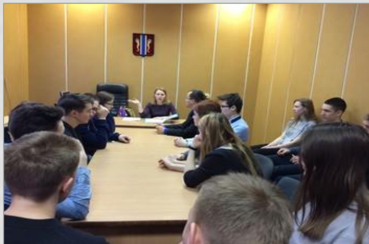
День парламентаризма в новолодожской школе №1

Впервые официальные мероприятия в День российского парламентаризма прошли в 2013 году. В этот день организуются лекции и выставки, посвященные истории российских выборных учреждений, в школах проходят уроки парламентаризма.