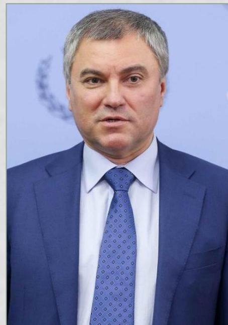
Вячеслав Викторович Володин