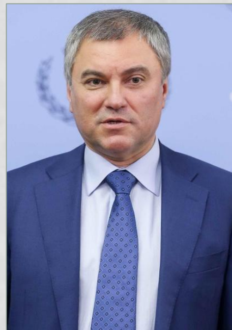
Вячеслав Викторович Володин