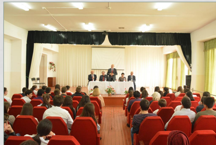
Депутаты проводят уроки парламентаризма в школах