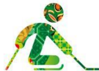
Следж - хоккей