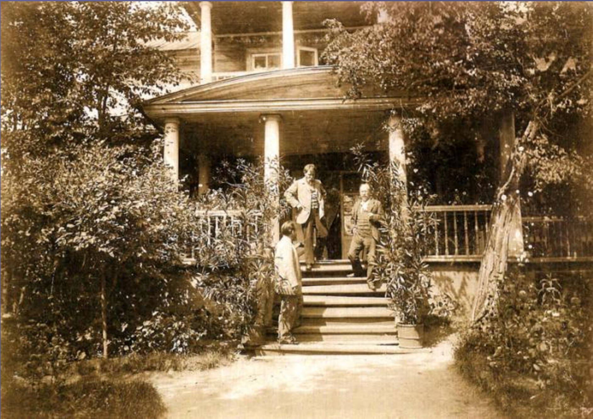
На крыльце господского дома в имени Михайловский завод