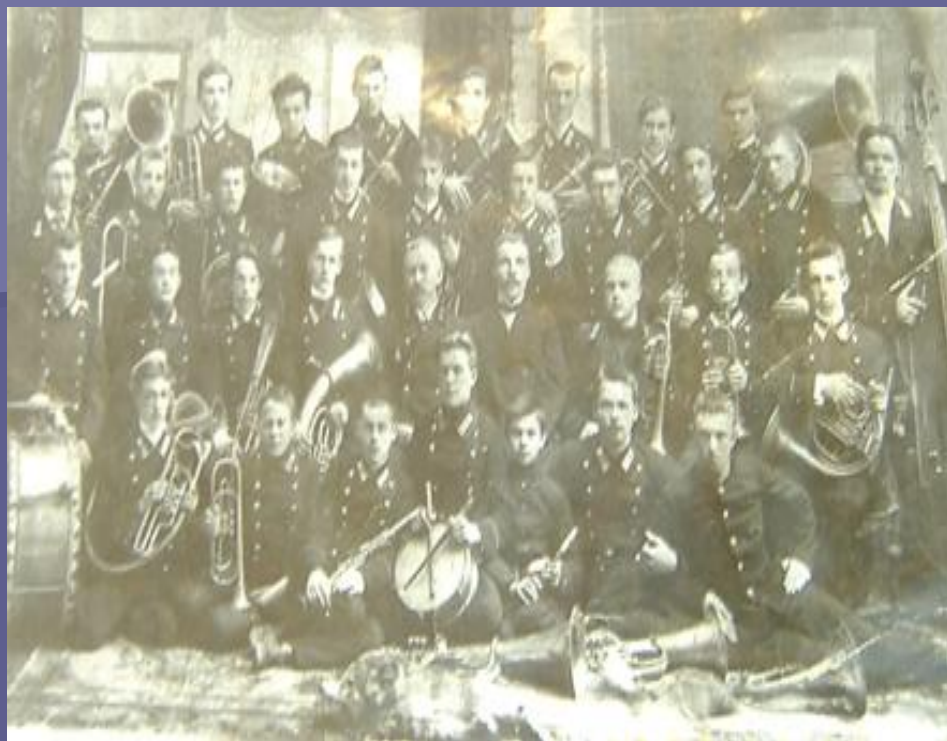
Духовий оркестр Чернігівської духовної семінарії.

У 1900-1907 рр. навчався в Чернігівському духовному училищі (бурсі), в 1907-1913— в Чернігівській духовній семінарії.