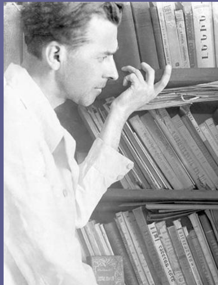
Павло Тичина у своїй бібліотеці, 1932 р.

З 1947 р. — член-кореспондент Болгарської АН, доктор філології.