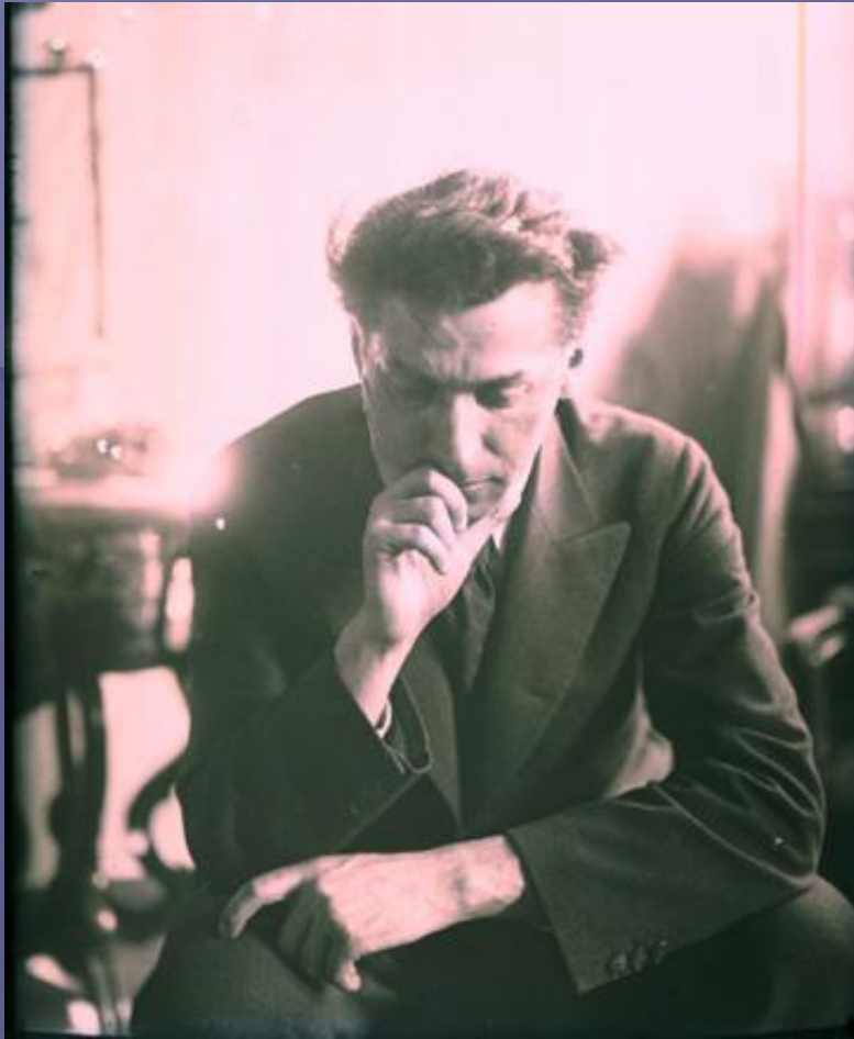
Павло Тичина, 1930-ті роки.

Приховане протистояння з тоталітаризмом засвідчують окремі поетичні, літературознавчі, публіцистичні твори пізнішого часу: «Григорій Сковорода» (1939), «Похорон друга» (1942), «Творча сила народу», «Геть брудні руки від України» (1943)