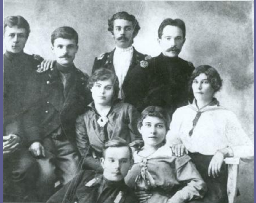
Павло Тичина серед друзів, 1913--1914 рр.

Перші друковані твори молодого поета з'явилися 1912 р.