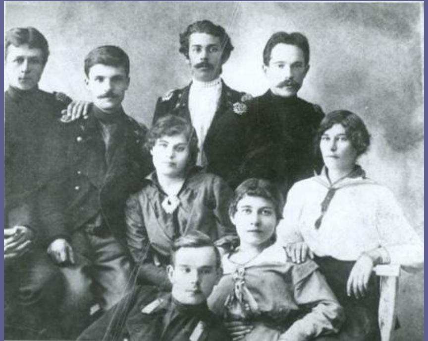
Павло Тичина серед друзів, 1913--1914 рр.

Перші друковані твори молодого поета з'явилися 1912 р.