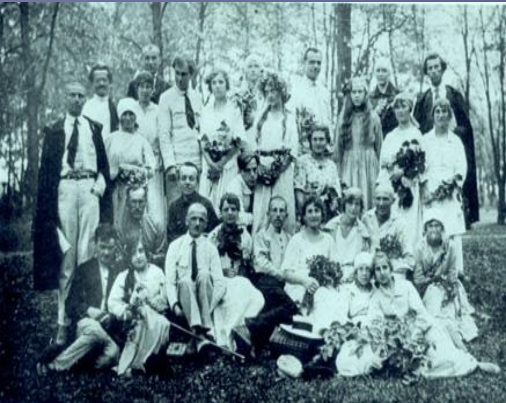
Хор ім. М. Леонтовича під орудою Павла Тичини, початок 1920-х років.

У 1916-1917 рр. — помічник хормейстера в українському театрі М. К. Садовського.