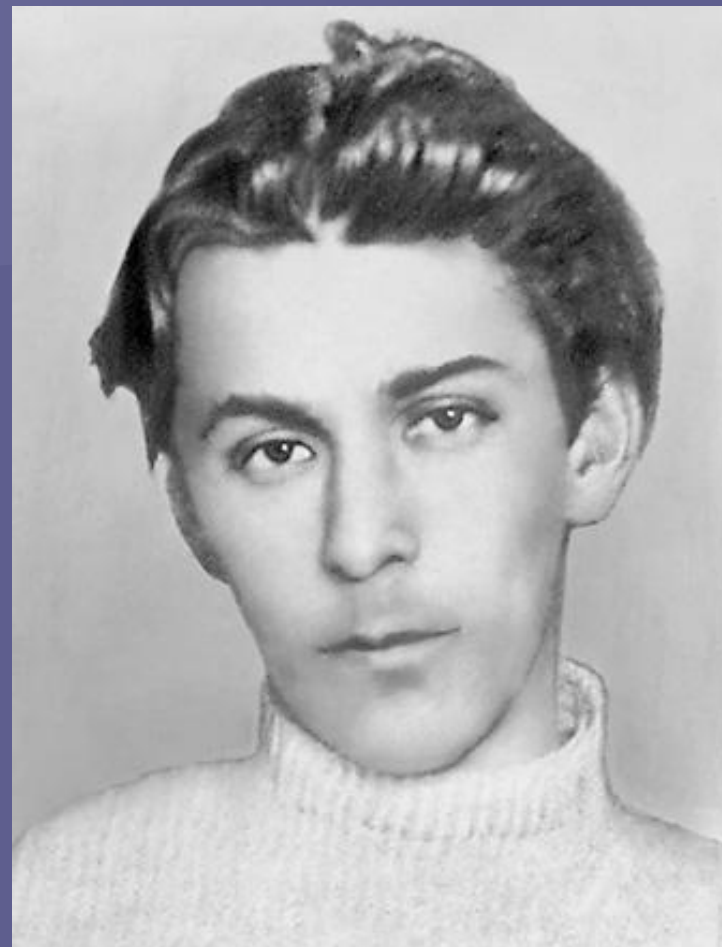
Павло Тичина в юнацькі роки.

У 1913-1914 рр. працює в редакції ліберального україномовного журналу «Світло», а після його закриття — в Чернігівському статистичному бюро.