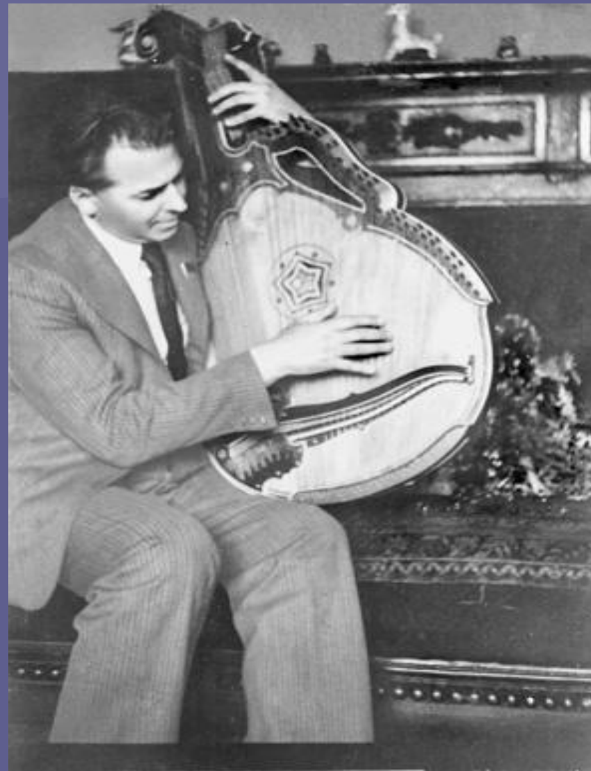
Павло Тичина з бандурою, 4 червня 1946 р.

У галузі поезії, прози, публіцистики, а також у науково- критичних працях Павло Тичина виявив себе одним із найосвіченіших радянських письменників, чия ерудиція охоплювала суміжні з літературою види мистецтва — музику і живопис.