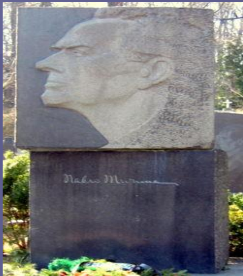
Надгробок Павла Тичини на Байковому цвинтарі в Києві

Похований на Байковому кладовищі в Києві