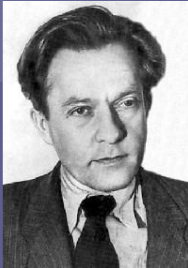
ПАВЛО ТИЧИНА (1891 — 1967)