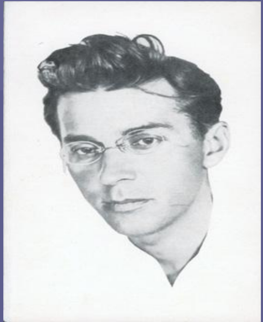
Павло Тичина, 1920-ті роки.