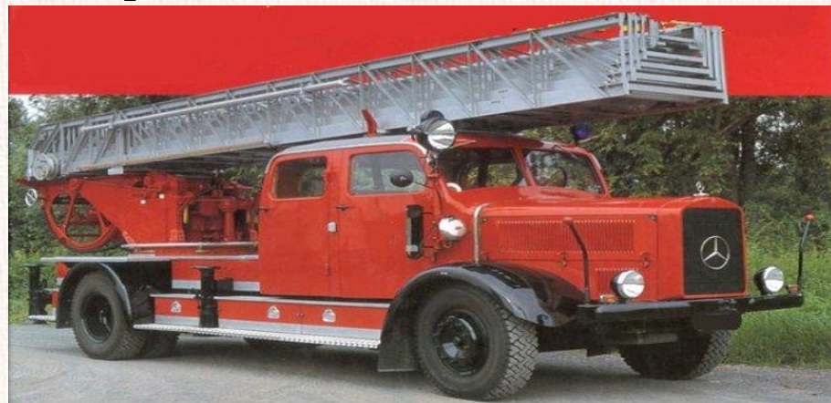
Пожарная машина MERCEDES-BENZ

Mercedes Benz, BMW, Nissan, Фольксваген, Форд Фиеста