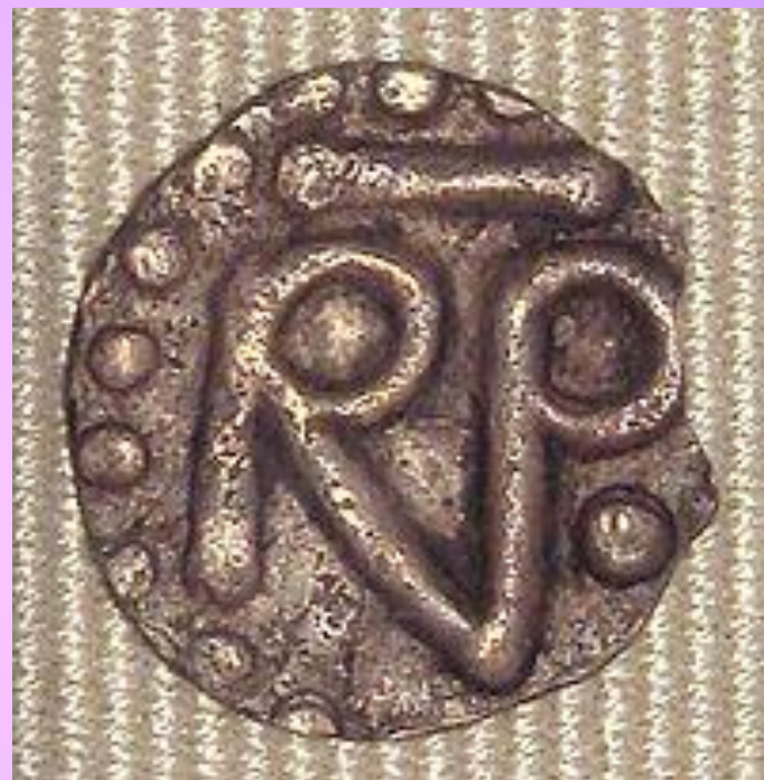
Деньги во времена Пипина Короткого