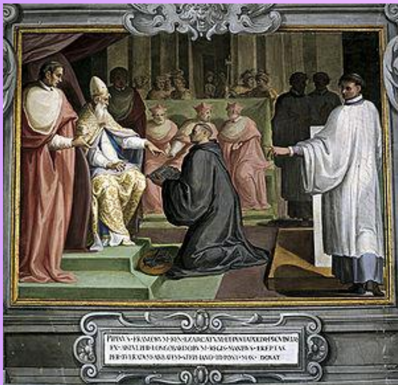
Пипин преподносит папе Владение Папской областью!