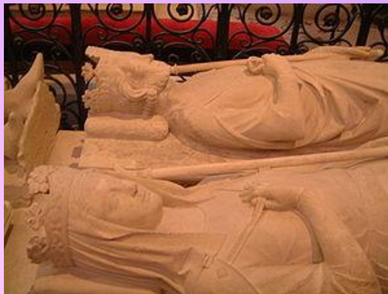
Саркофаг Бертрады и Пипина Короткого в аббатстве Сен-Дени.