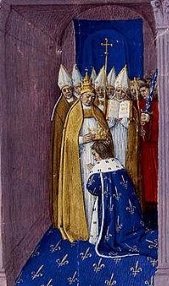
Провозглашения Пипина Короткого королём