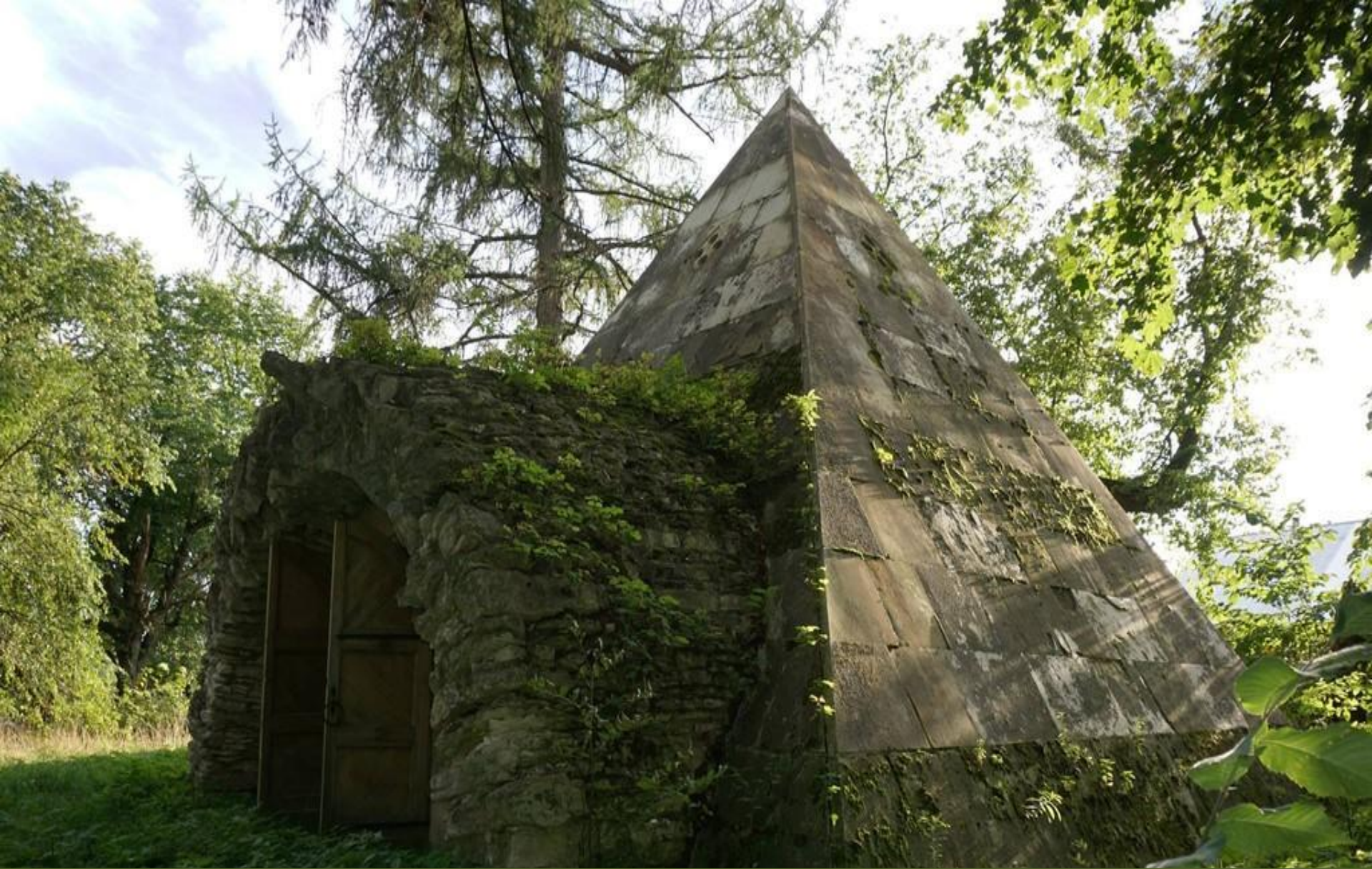
Торжок Тверской области. Пирамида-погреб архитектора Н.Львова