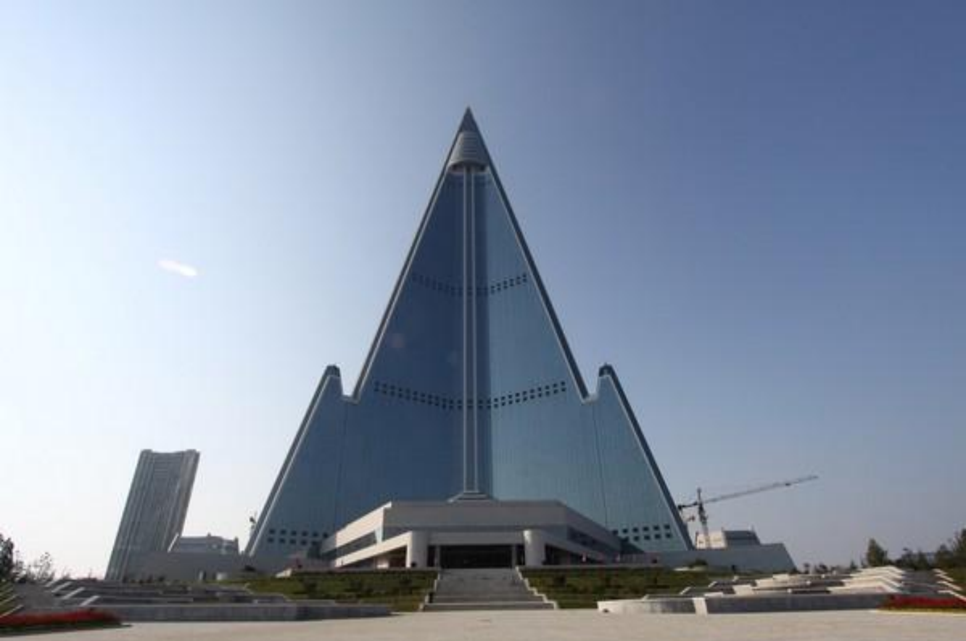
Гостиница Рюген в Пхеньяне