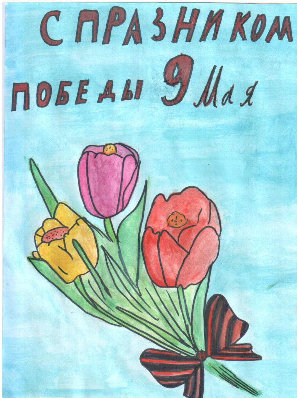
Пушина Ксения 5 класс