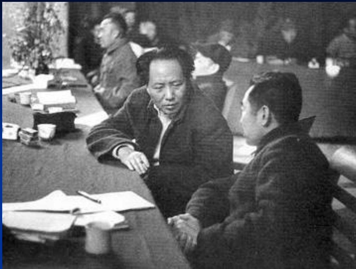
Седьмой съезд КПК. Мао и Чжоу Эньлай.