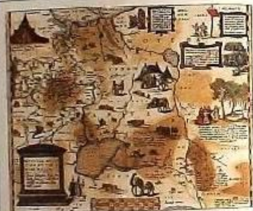
Россия на карте Антониуса Де Витта 1562 г.