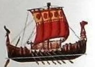
Русская боевая лодка, или биреня — голландский вариант

■ « Хождение за три моря » — памятник литературы в форме путевых записей (жанр хождения ), сделанных купцом из Твери Афанасием Никитиным во время его путешествия в индийское государство Бахмани в 1468—1474 годах