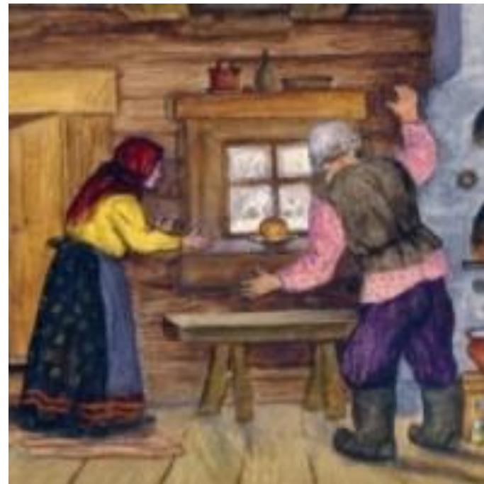
Колобок - русская народная сказка

«Какая славная песенка! — сказала лиса. — Но ведь я, колобок, стара стала, плохо слышу; сядь-ка на мою мордочку да пропой еще разок погромче». Колобок вскочил лисе на мордочку и запел ту же песню. «Спасибо, колобок! Славная песенка, еще бы послушала! Сядь-ка на мой язычок да пропой в последний разок», — сказала лиса и высунула свой язык; колобок сдуру прыг ей на язык, а лиса — ам его! и скушала.