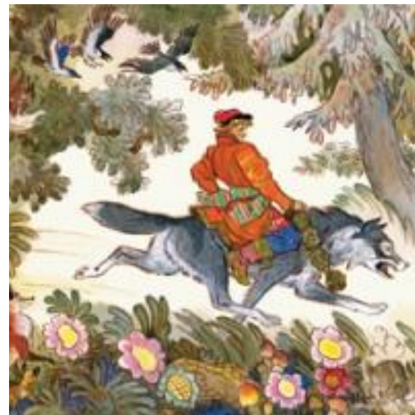
Иван-царевич и серый волк - русская народная сказка

Иван-царевич дотронулся до уздечки, пошел звук по всей крепости: трубы затрубили, барабаны забили, сторожа проснулись, схватили Иван-царевича и повели к царю Кусману.