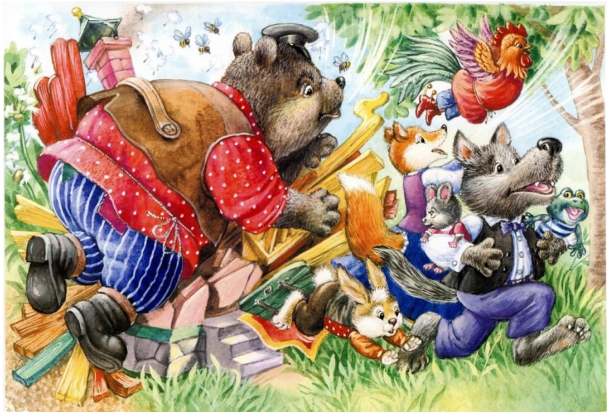
Теремок - русская народная сказка

Медведь и полез в теремок. Лез-лез, лез-лез — никак не мог влезть и говорит: — А я лучше у вас на крыше буду жить. — Да ты нас раздавишь. — Нет, не раздавлю. — Ну так полезай! Влез медведь на крышу и только уселся — трах! — развалился теремок. Затрещал теремок, упал набок и весь развалился.