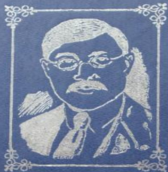
Халел Досмухамедұлы таңдамалы избранное

анализирует сущность общественно-политических, социально-культурных и педагогических явлений и процессов, способствовавших формированию Х. Досмухамедова как личности; осуществляет анализ научных трудов учёного - исследователя, его учебники; выявляет их сущность, специфику.