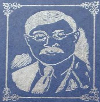
Халел Досмухамедұлы таңдамалы избранное

анализирует сущность общественно-политических, социально-культурных и педагогических явлений и процессов, способствовавших формированию Х. Досмухамедова как личности; осуществляет анализ научных трудов учёного - исследователя, его учебники; выявляет их сущность, специфику.