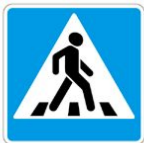
5.19.2 Пешеходный переход