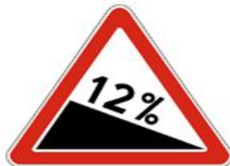
1.13 Крутой спуск