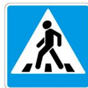
5.19.1 Пешеходный переход