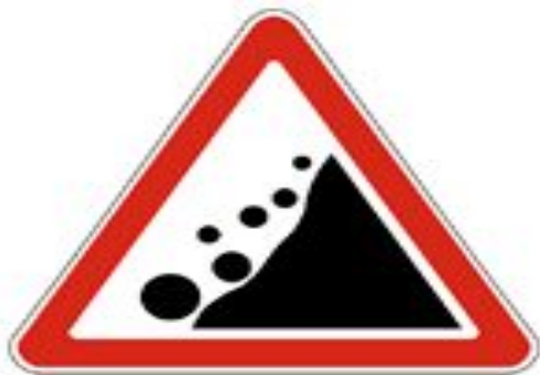
1.28 Падение камней