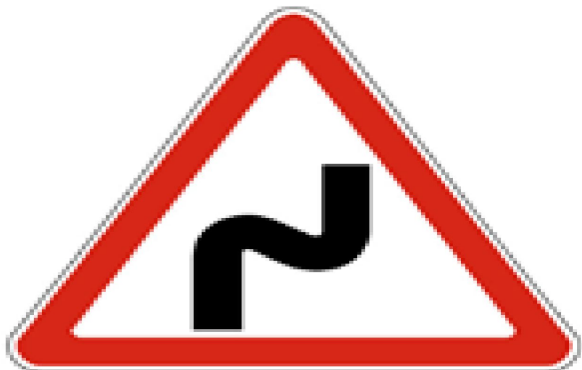
1.12.1 Опасные повороты