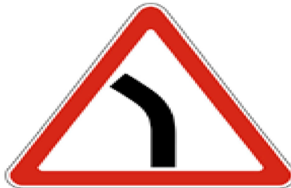
1.11.2 Опасный поворот