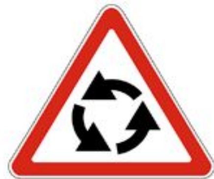
1.7 Пересечение с круговым движением