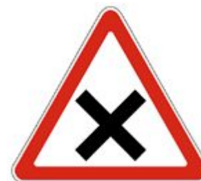
1.6 Пересечение равнозначных дорог