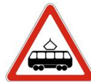
1.5 Пересечение с трамвайной линией