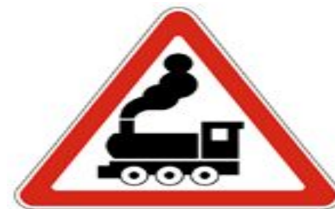
1.2 Железнодорожный переезд без шлагбаума