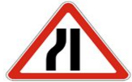
1.20.3 Сужение дороги слева