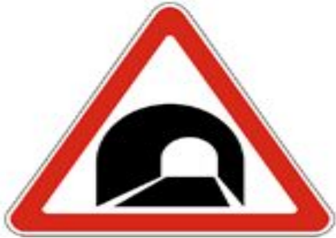
1.31 Тоннель (отсутствует искусственное освещение)