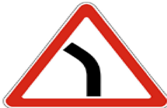
1.11.2 Опасный поворот