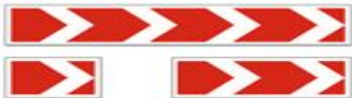
1.34.1 Направление поворота