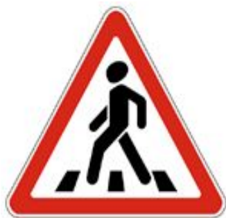
1.22 Пешеходный переход