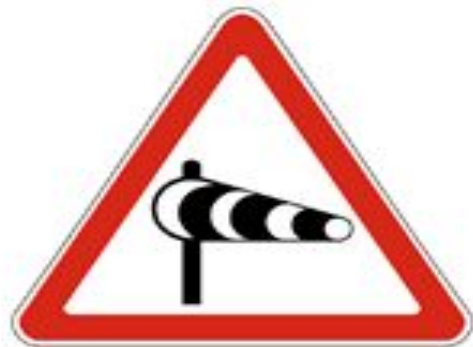
1.29 Боковой ветер