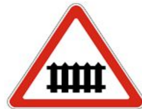
1.1 Железнодорожный переезд со шлагбаумом