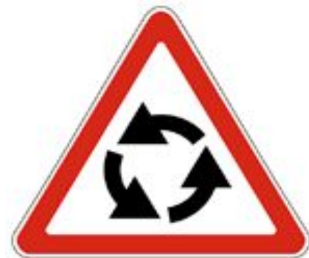
1.7 Пересечение с круговым движением