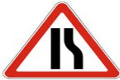
1.20.2 Сужение дороги справа