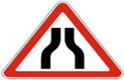
1.20.1 Сужение дороги с обеих сторон