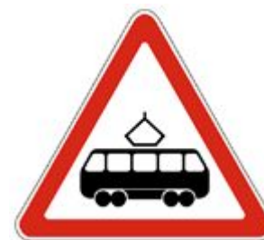
1.5 Пересечение с трамвайной линией