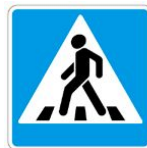
5.19.1 Пешеходный переход