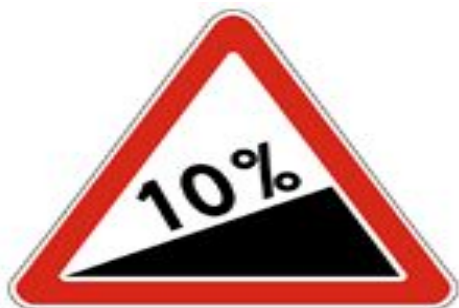
1.14 Крутой подъем