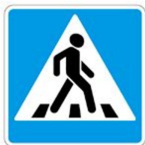
5.19.2 Пешеходный переход