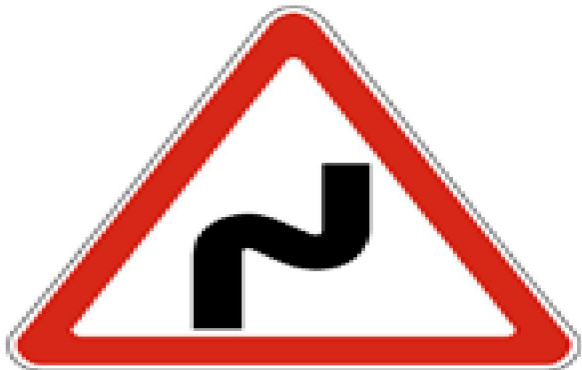
1.12.1 Опасные повороты