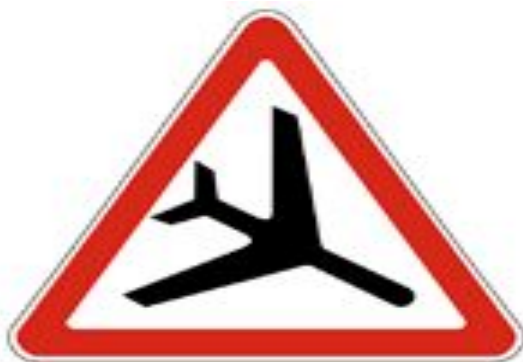
1.30 Низколетящие самолеты