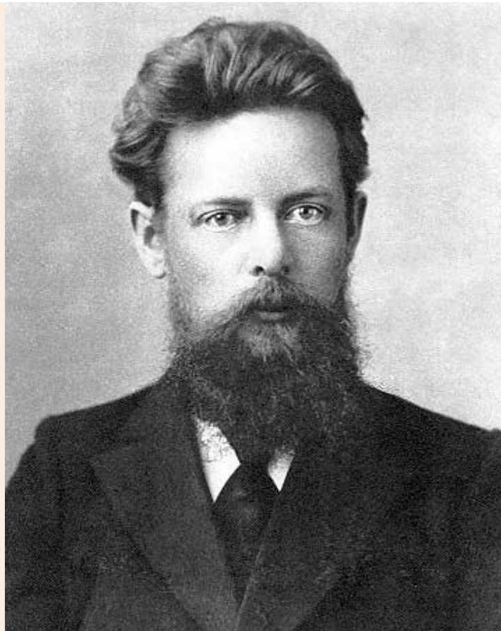
Павел Петрович Бажов