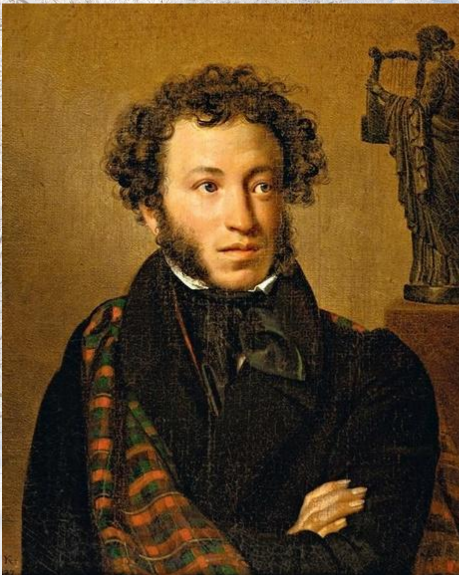
Пушкин Александр Сергеевич