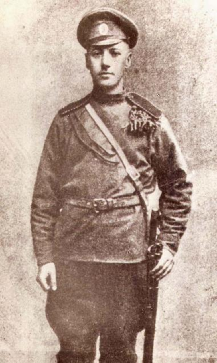
Николай Гумилев в форме Уланского

7 октября. Начало войны сблизило супругов. Гумилев писал Ахматовой из армии: «Дорогая моя Аничка, я уже в настоящей армии, но мы пока не сражаемся, и когда начнем, неизвестно. <...> И я начинаю чувствовать, что я подходящий муж для женщины, которая „сбирала французские пули, как мы собирали грибы и чернику“. Эта цитата заставляет меня напомнить тебе о твоём обещании быстро дописать твою поэму и прислать ее мне. Право, я по ней скучаю. Я написал стишок, посылаю его тебе, хочешь продай, хочешь читай кому-нибудь. Я здесь утерять критические способности и не знаю, хорош он или плох