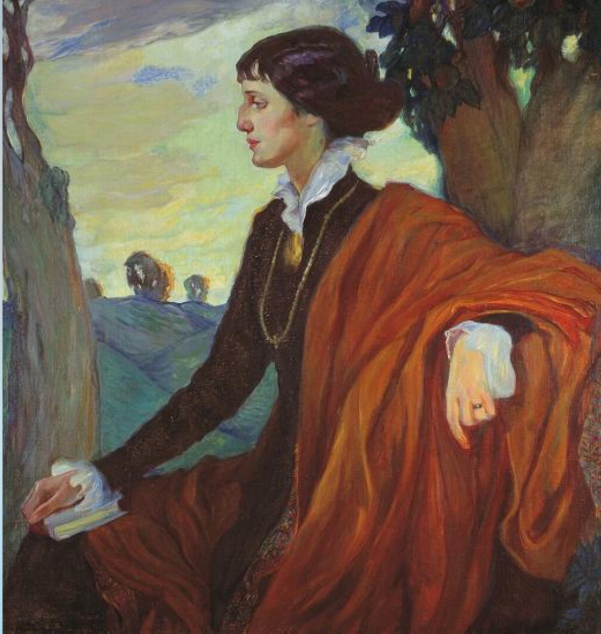
Ольга Делла-Вос Кардовская Портрет Ахматовой 1914 г.