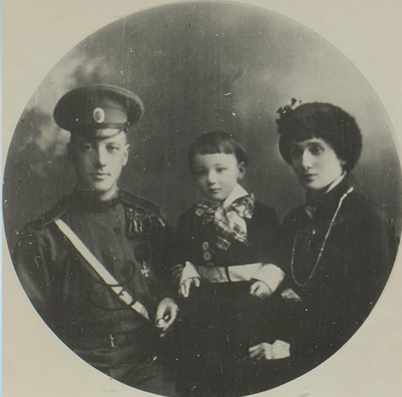
Анна Ахматова и Николай Гумилев с сыном Львом. 1915 год