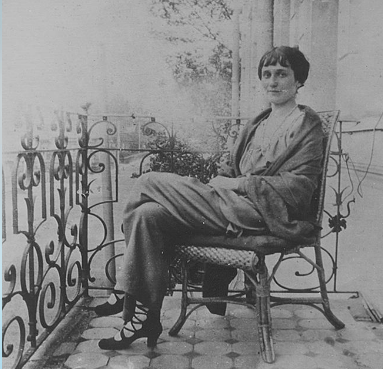
Анна Ахматова на балконе у художников Дмитрия Кардовского и Ольги Делла-Вос-Кардовской. Царское Село, 1915 год