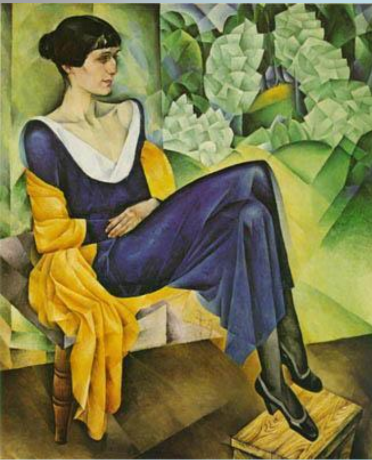
Натан Альтман Портрет Ахматовой 1915 г.