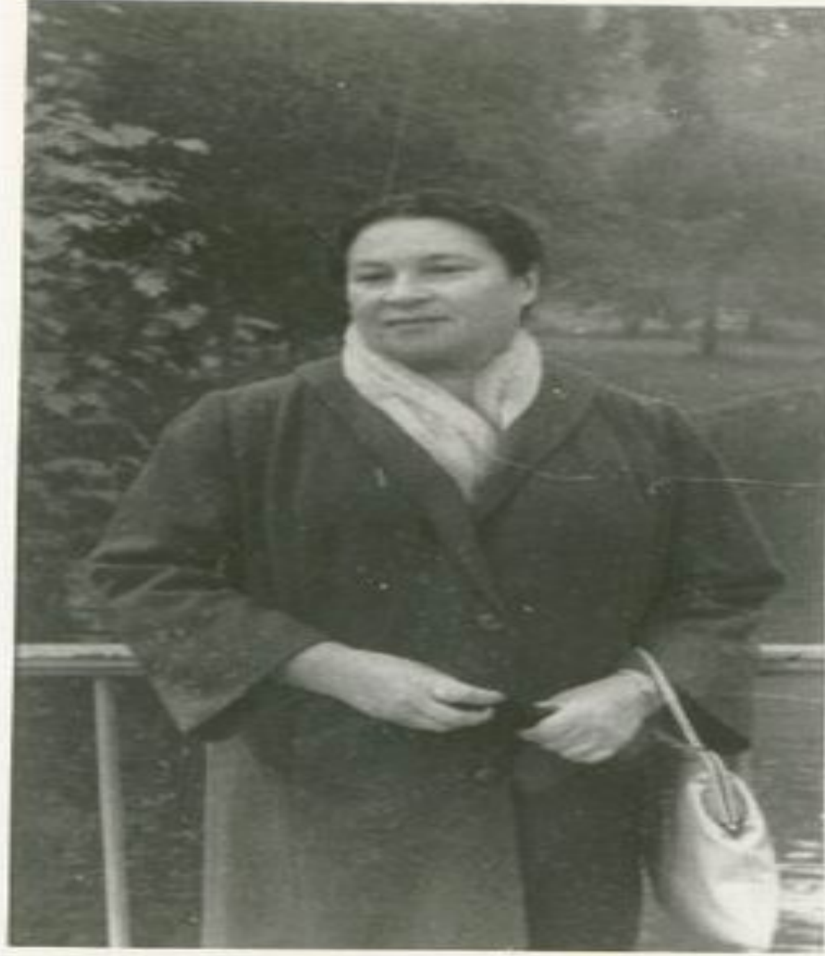
Ybentekasing Amatorua Gudubay Ka Kaiti. A very fine