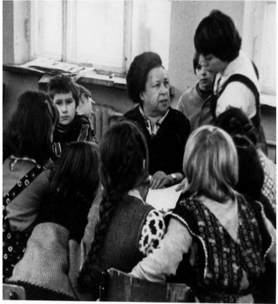
Агния Барто с учащимися школы. 1978 г.

В течение многих лет Барто возглавляла Ассоциацию деятелей литературы и искусства для детей. Стихи Барто переведены на многие языки мира. Её имя присвоено одной из Малых планет.