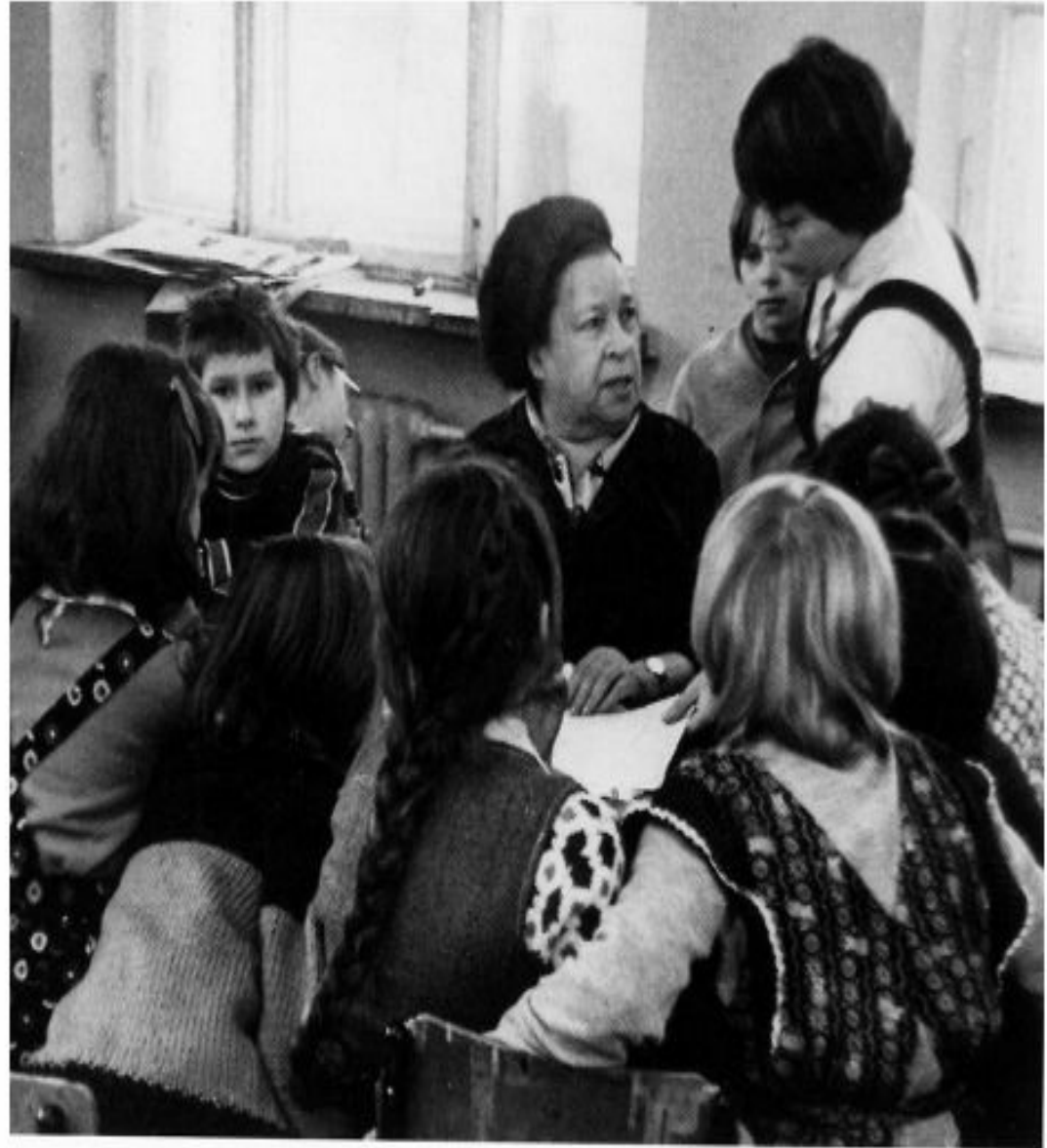
Агния Барто с учащимися школы. 1978 г.

В течение многих лет Барто возглавляла Ассоциацию деятелей литературы и искусства для детей. Стихи Барто переведены на многие языки мира. Её имя присвоено одной из Малых планет.