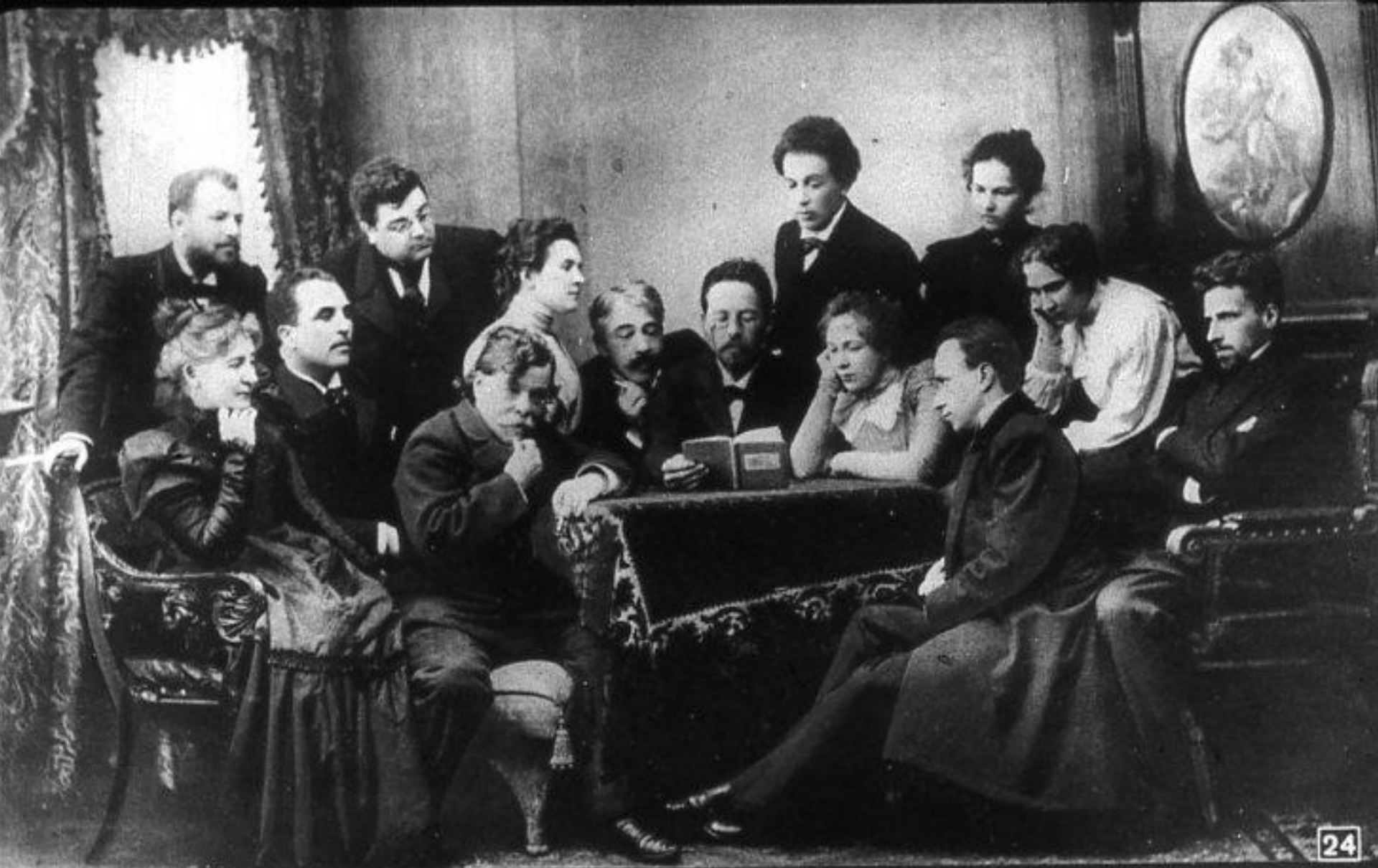
Вот фотография, сделанная в 1899 г. на память о постановке „Чайки“ на сцене Художественного театра. Это было в дни начала дружбы писателя с актерами и основателями МХАТа.