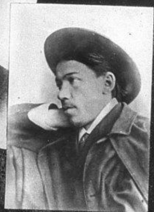
Среди портретов — фотографии братьев: беллетриста Александра, литератора и первого биографа Антона Павловича — Михаила, педагога Ивана и художника Николая.