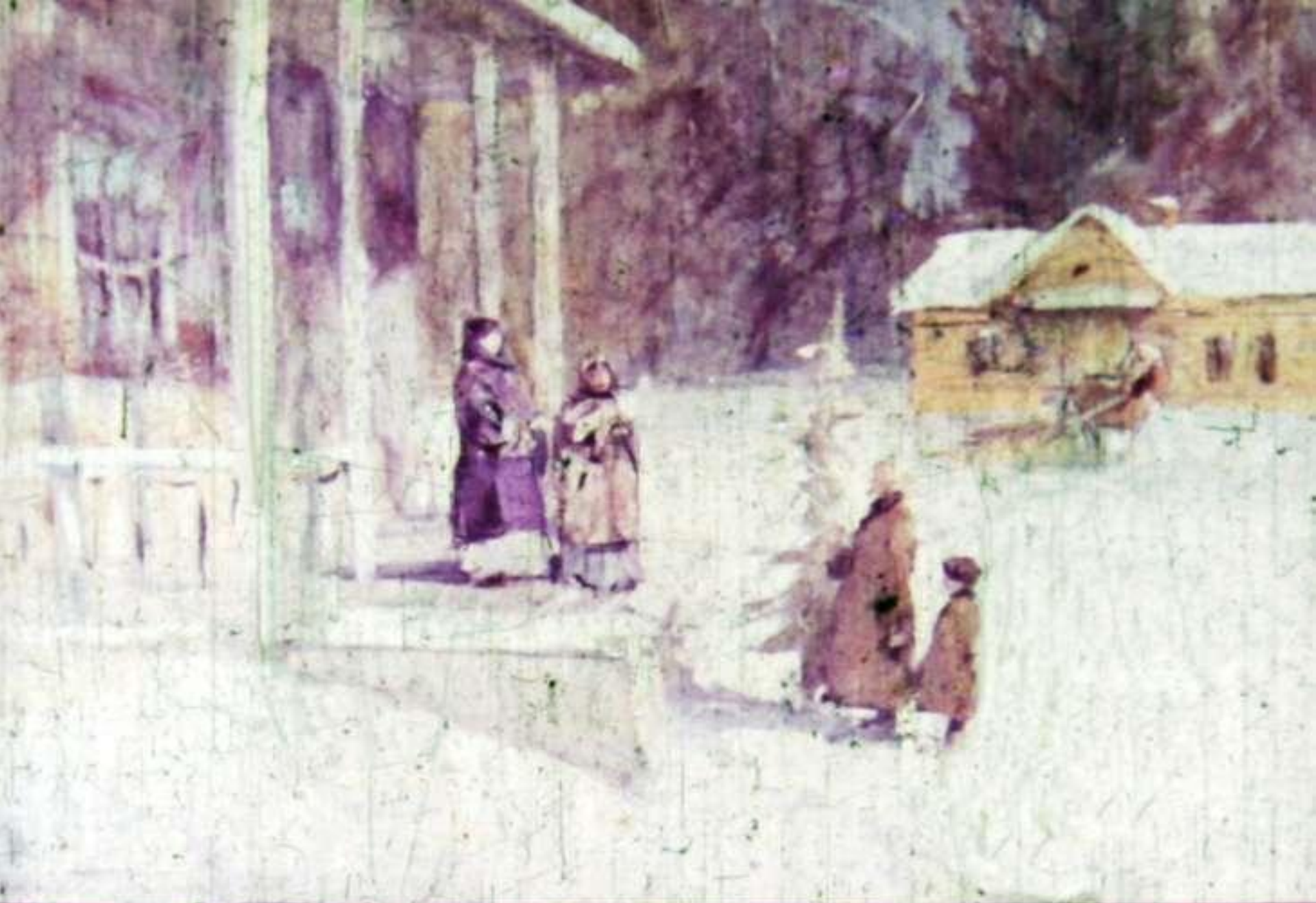
Срубленную ёлку дед тащил в господский дом,