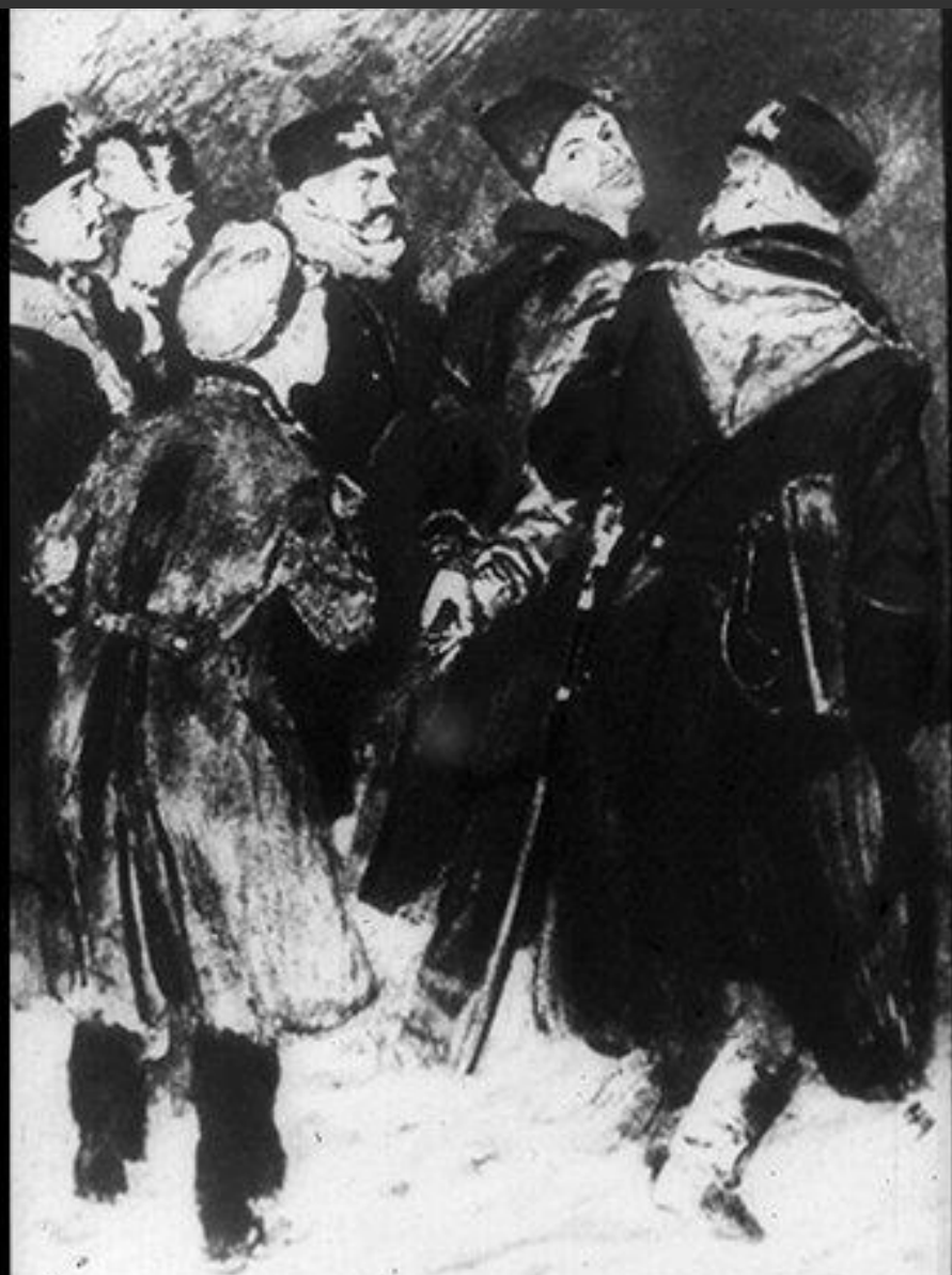
266.13 Арест отца. Рис. В. Шергина