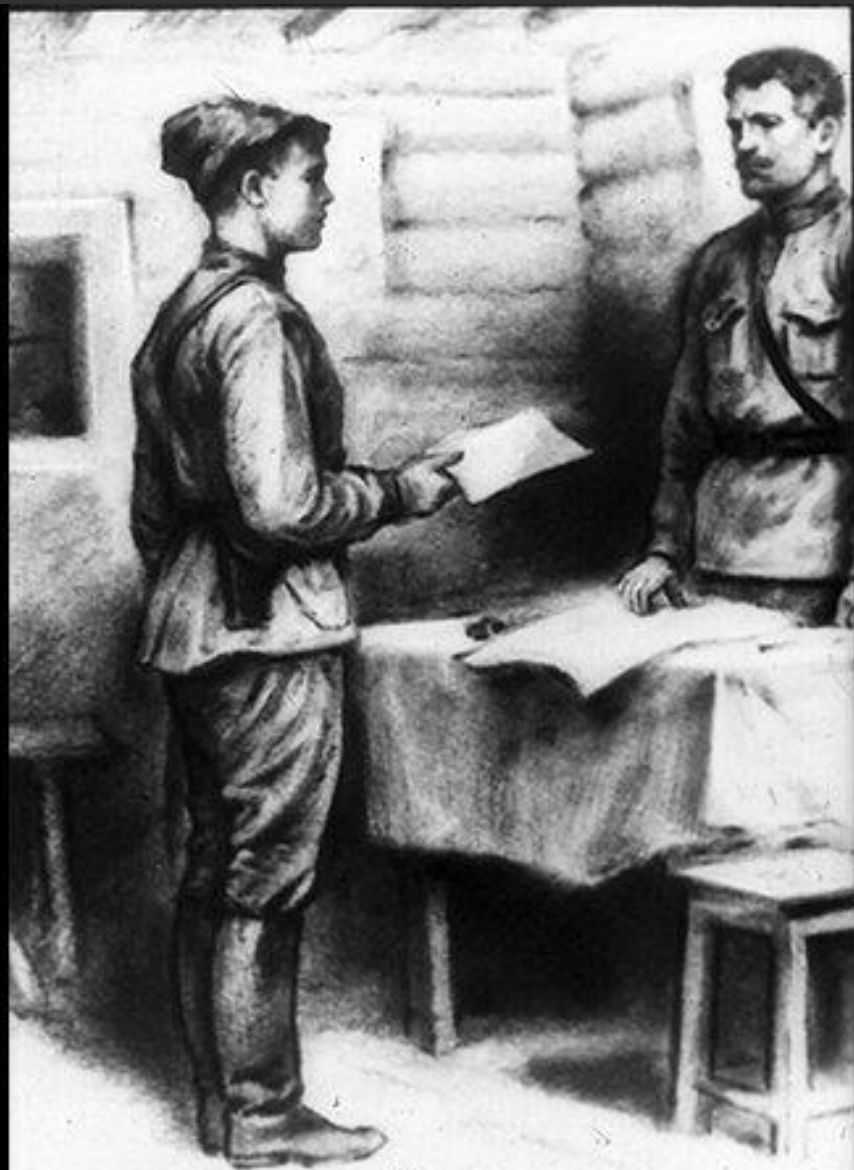
266. 27 Прием Бориса в партию Рис. Л. Голованова