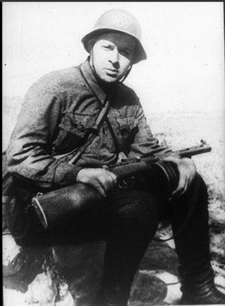
266. 29 А. П. Гайдар — солдат Фото 1941 г.