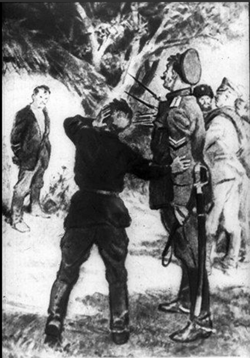
266.25 · Расстрел Чубука. Рис. В. Шеглова