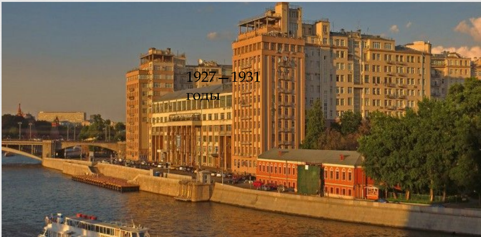
Дом на набережной. (1927-1931 гг). Архитектор Борис Михайлович Иофан.