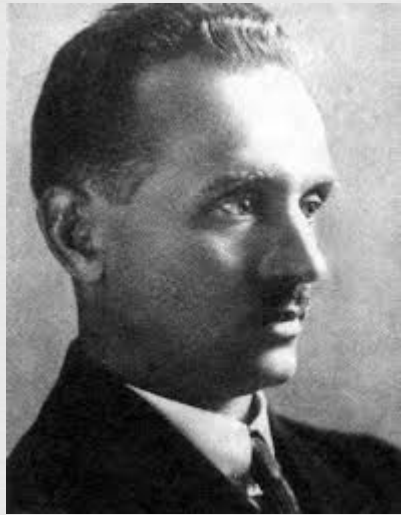
Мельников К.С (1890-1979 гг.)