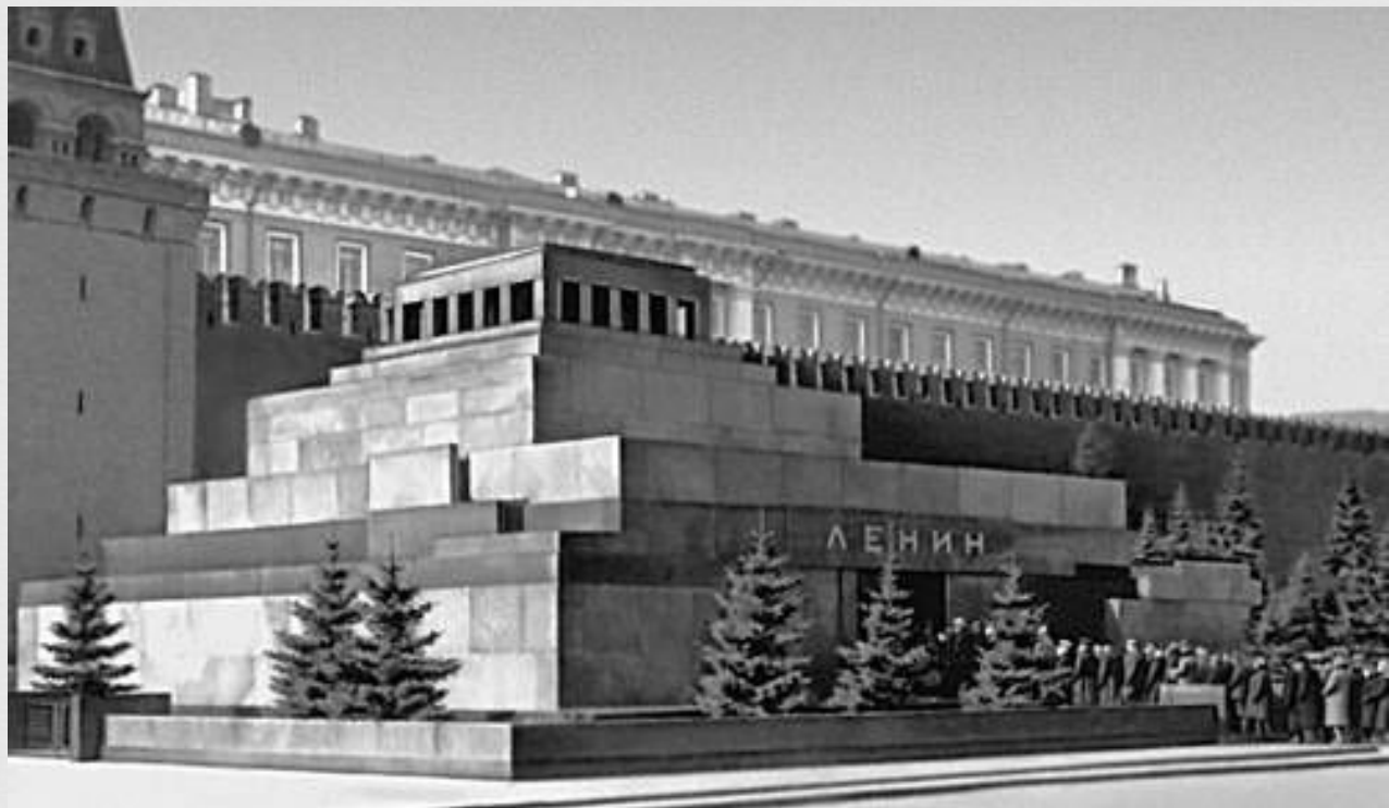
Мавзолей В. И. Ленина. Москва, Красная площадь. Габронорит, гранит,

Известное произведение времен конструктивизма — работа архитектора Алексея Викторовича Щусева, мавзолей Ленина на Красной площади. Здание было возведено из железобетона, облицовано гранитом и лабрадоритом. Это постройка объединила в себе черты конструктивизма и ар-деко, сменившего и модерн, и конструктивизм.