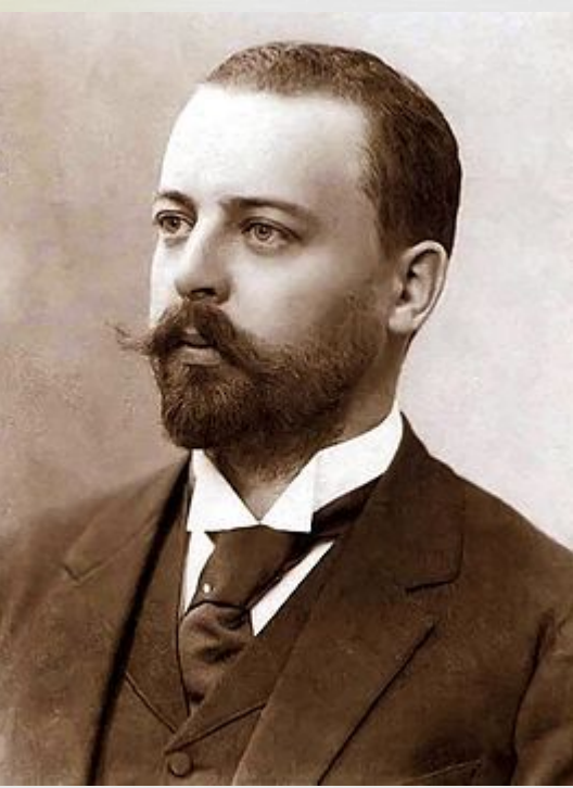
Федор Осипович Шехтель 1859 -1926 гг.

В России стиль модерн был представлен, в первую очередь, работами архитектора Федора Осиповича Шехтеля. Глобальный проект Шехтеля – здание Ярославского вокзала. Ярославская железная дорога связывала Москву с Белым морем и северными губерниями, поэтому Шехтель избрал для своего проекта новорусский стиль, преломленный, конечно, архитектором в индивидуальной манере. В 1901 году Шехтель проектировал павильоны для международной выставки в Глазго, где он впервые занялся переработкой древнерусских мотивов в архитектуре. В проекте вокзала сложные архитектурные решения совмещены с необыкновенной простотой, вокзал напоминает северные погосты-тройники. Декоративная лепнина, керамические панно, выполненные в абрамцевской мастерской – всё это отражает гениальный замысел Шехтеля.