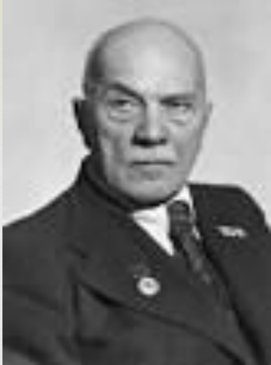
Алексей Викторович Щусев (1873-1949гг)

Известное произведение времен конструктивизма — работа архитектора Алексея Викторовича Щусева, мавзолей Ленина на Красной площади. Здание было возведено из железобетона, облицовано гранитом и лабрадоритом. Это постройка объединила в себе черты конструктивизма и ар-деко, сменившего и модерн, и конструктивизм.