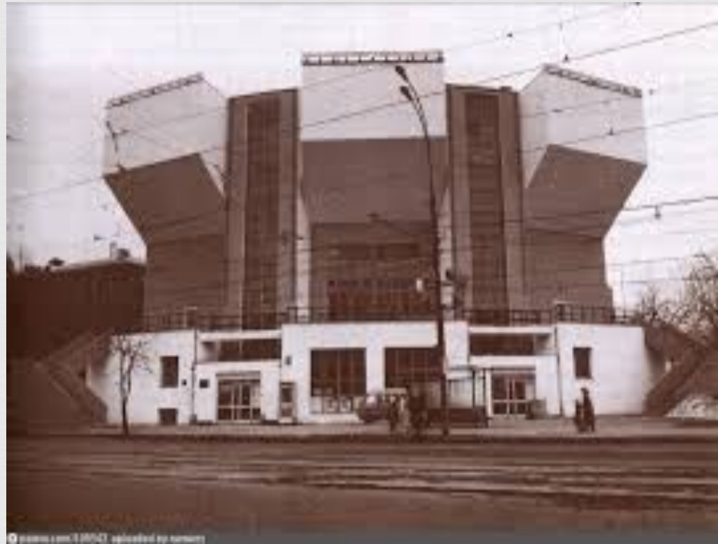
Мельников К.С. Клуб им. Русакова 1927г. - 1929г.