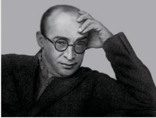
Моисей Гинзбург, фото 1920-х годов

Моисей Яковлевич Гинзбург (23 мая (4 июня) 1892, Минск — 7 января 1946, Москва) — советский архитектор, практик, теоретик и один из лидеров конструктивизма.