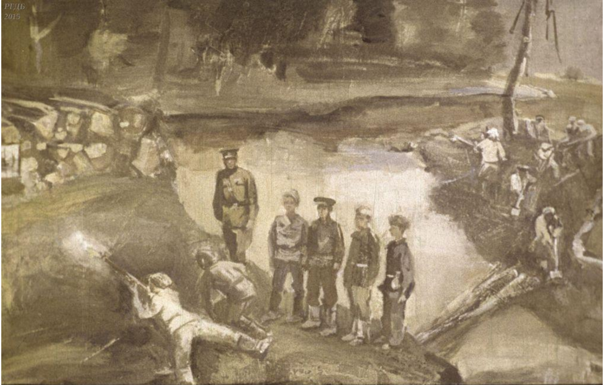
Старшие в это время рыли окопы, отводные осушительные канавы, учились стрелять. А тем временем фронт приближался к Брестской области.