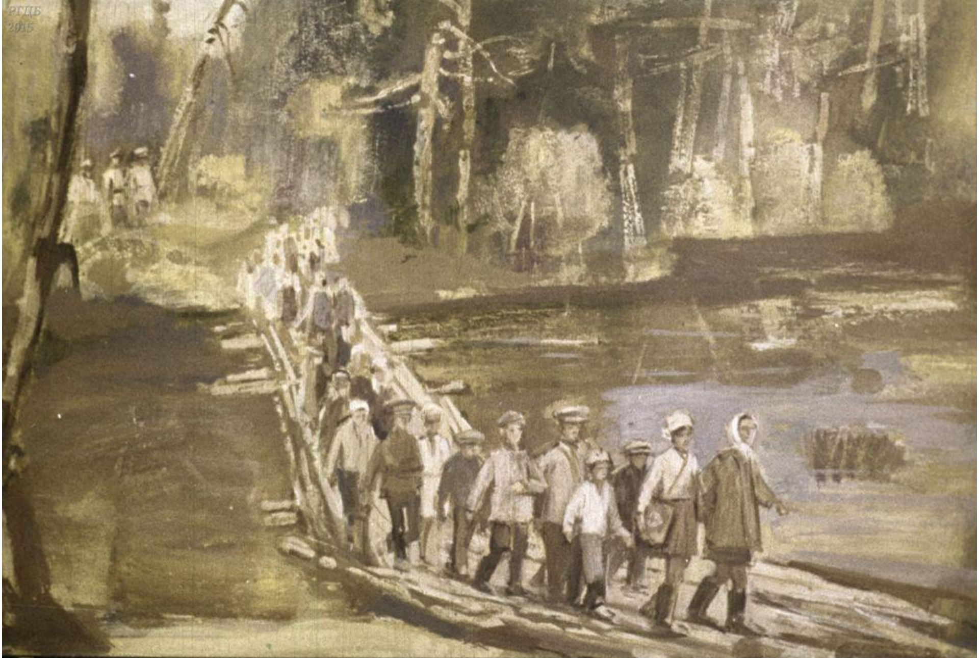
Вскоре торжественным маршем ребята отправились на свой первый урок.