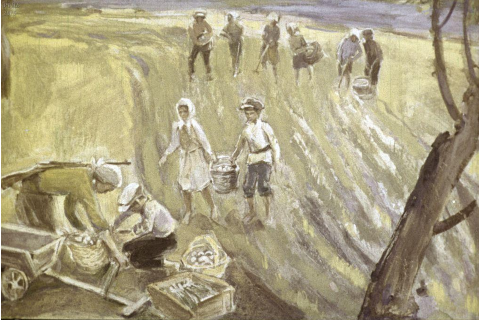
Завели пришкольный огород. Ранним летом уже ели свой зелёный лук, а потом репку, морковь.