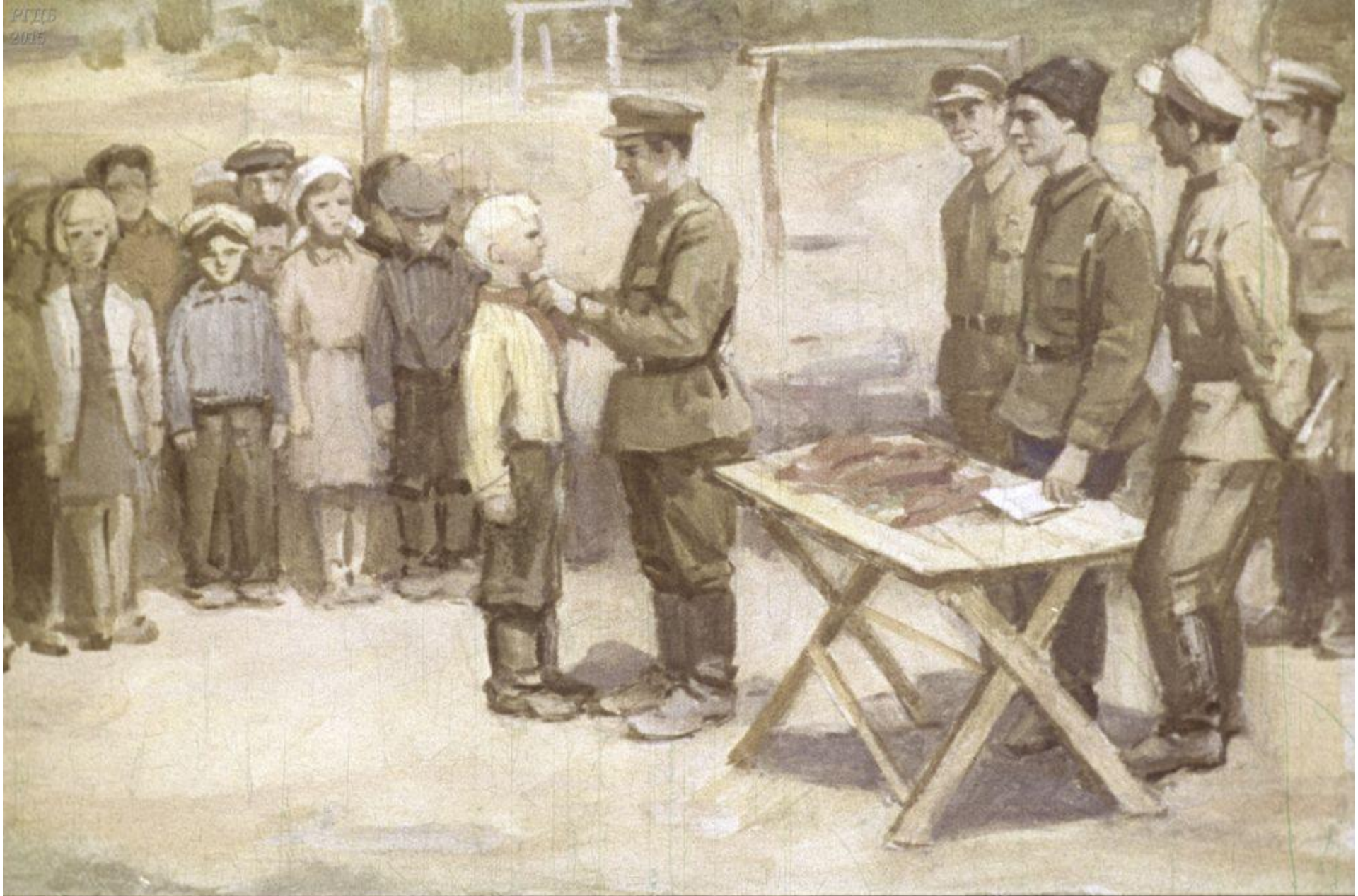
В начале июня в присутствии командования партизанской бригады ребят торжественно принимали в пионеры.