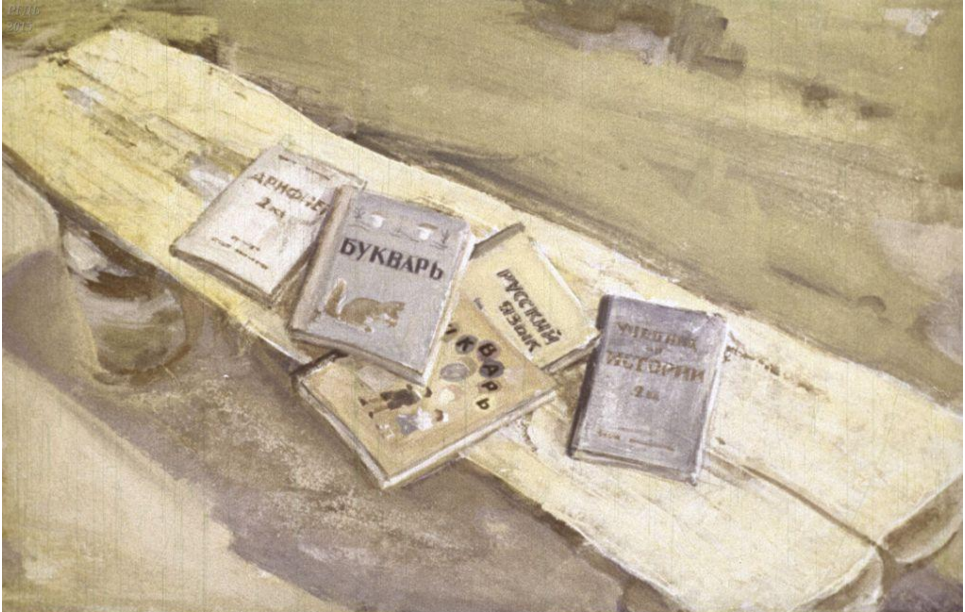
Вот и все учебные пособия, которые нашлись в семейных землянках. На 92 человека – не густо! И ни карандаша, ни чернил, ни бумаги.