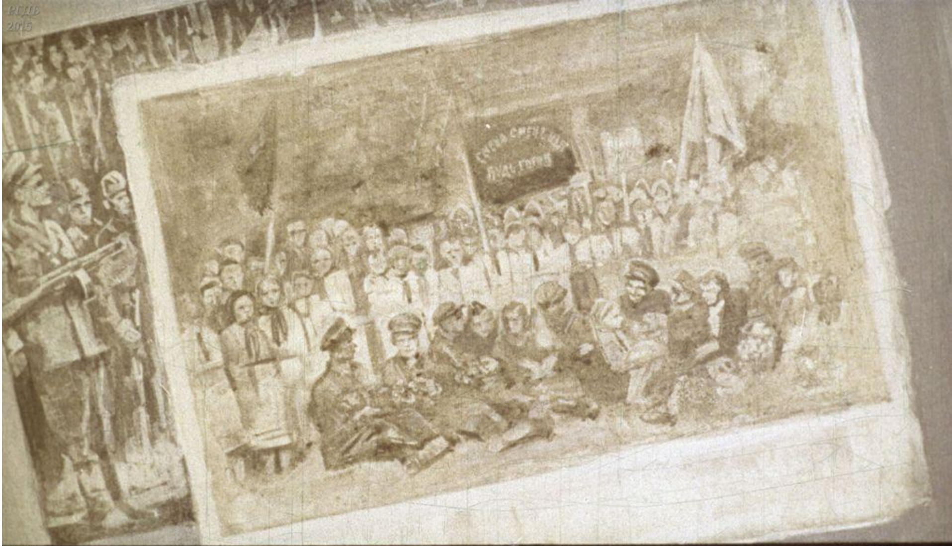
Всмотритесь в эту фотографию. Здесь много разных людей. Иных уже нет в живых, других – не узнать, постарели, изменились. А ребята выросли, стали колхозниками, рабочими, врачами, инженерами. Но особенно много из этой школы вышло учителей.