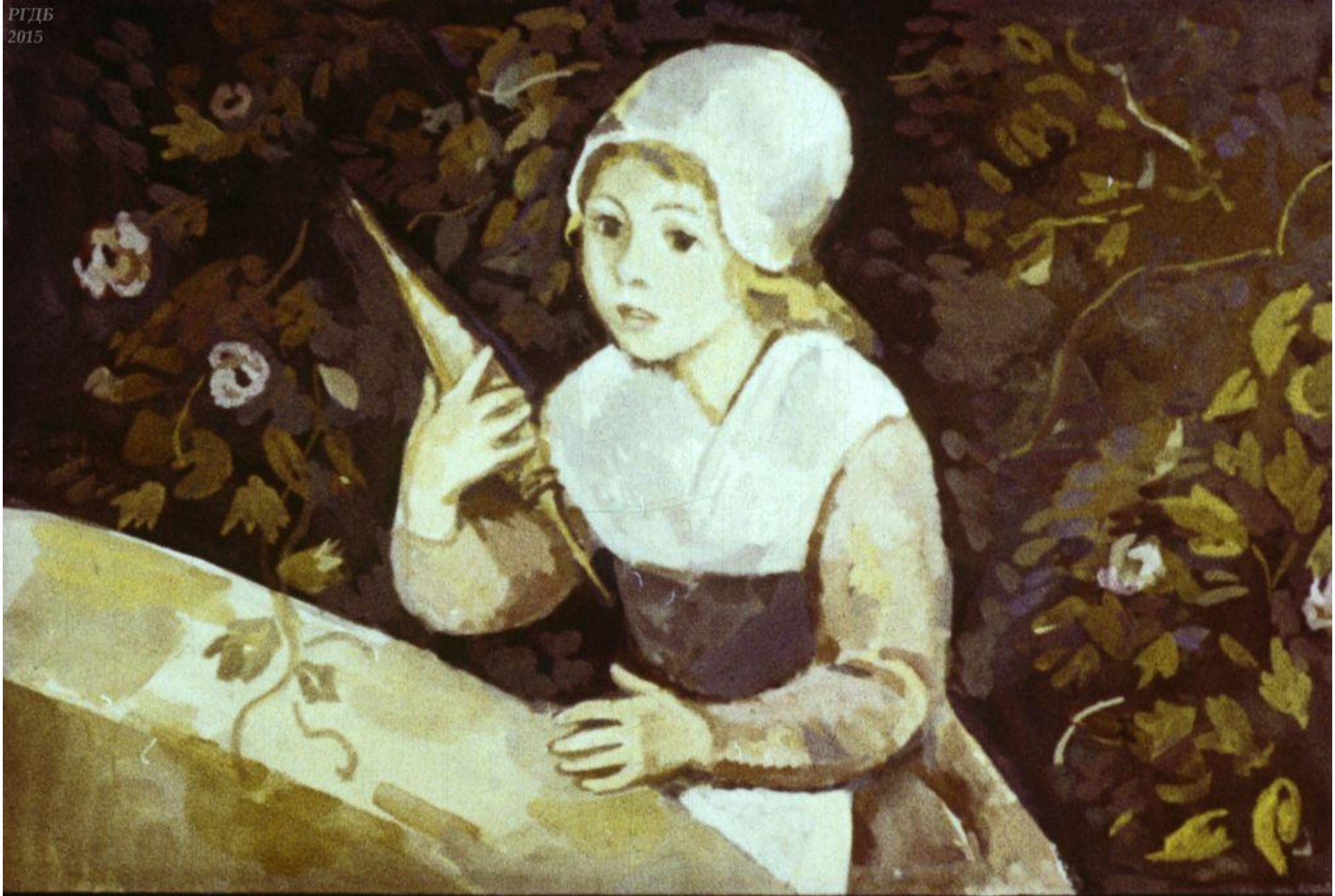
Вот как-то раз девочка заметила, что веретено испачкано кровью. Она хотела его обмыть и наклонилась над колодезцем. 5