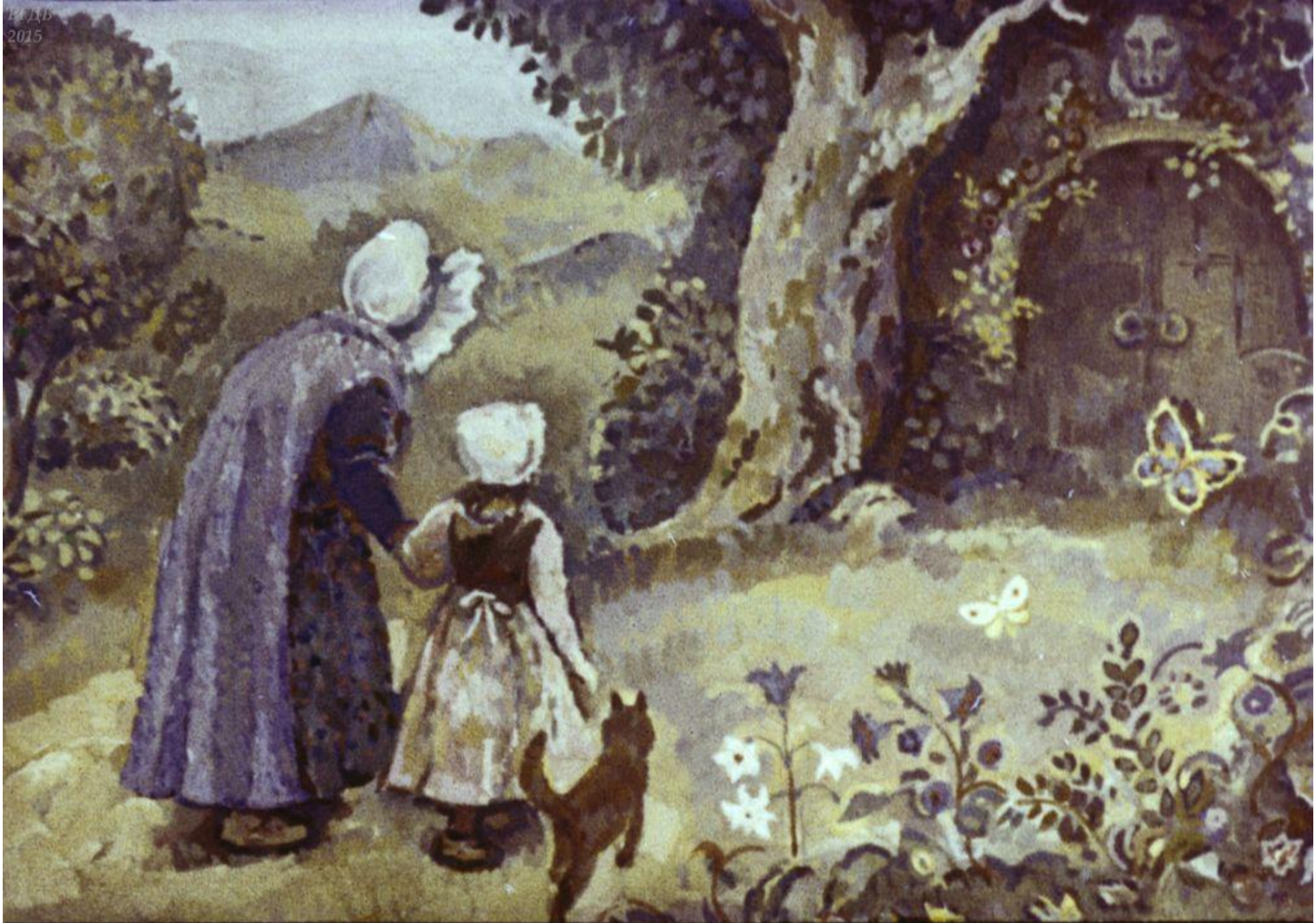
Она взяла девочку за руку и привела к большим воротам.