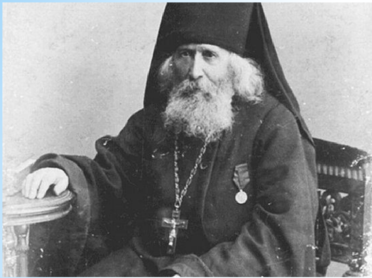
Преподобный Варнава Гефсиманский

Всмотревшись в юношу, старец положил руку ему на голову и раздумчиво произнес: «Превознесешься своим талантом». Предсказание сбылось.