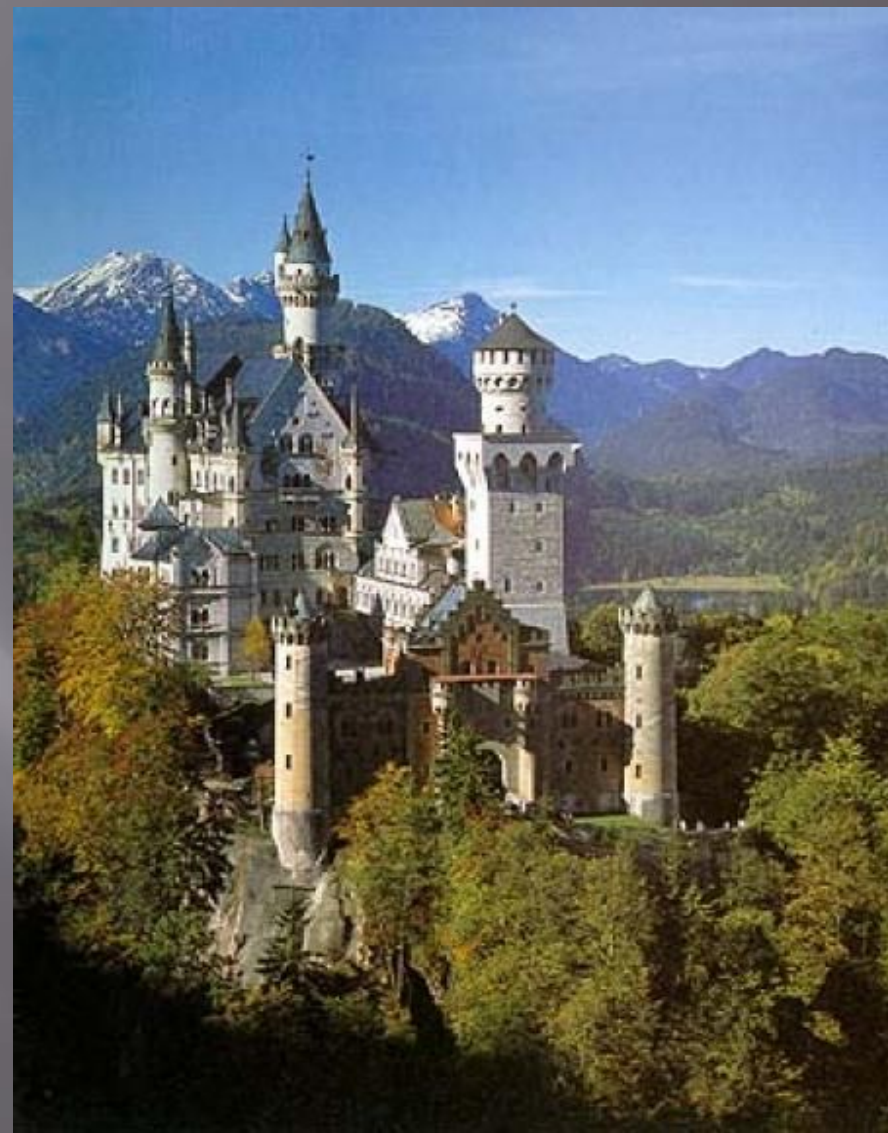
Один из многих замков Боснии