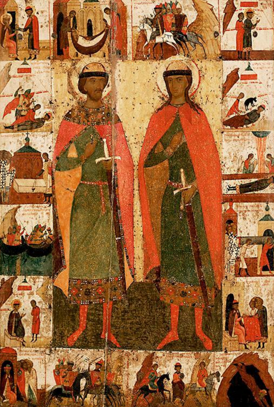
Икона неизвестного автора. Вторая половина XIV века

Почитать Бориса и Глеба начали раньше, чем крестителя Руси Владимира. Первых собственно русских святых иконописцы сразу стали изображать в княжеской одежде — не ориентируясь на византийские образцы. А спустя некоторое у них в руках к тому же появились не кресты — как у мучеников, а мечи — как у борцов за веру