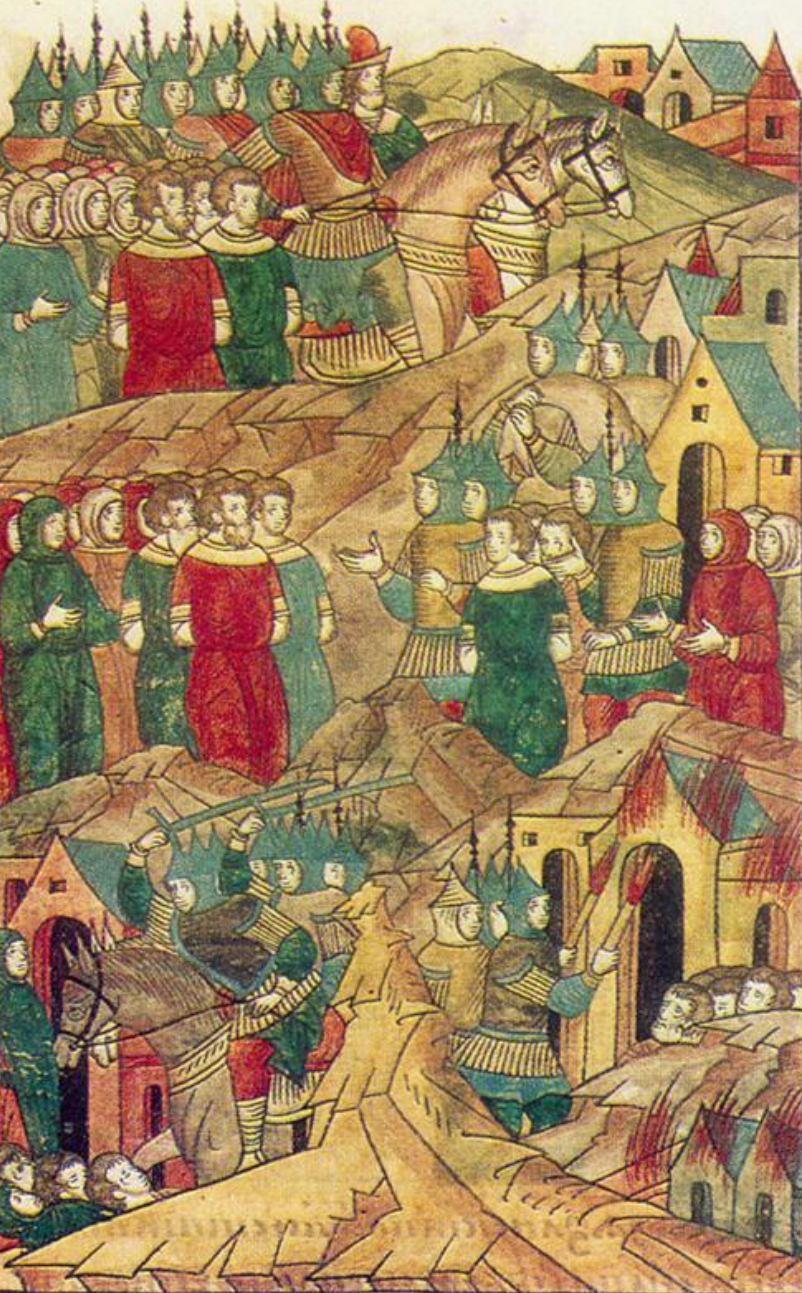
Миниатюра из Лицевого свода. XVI век.