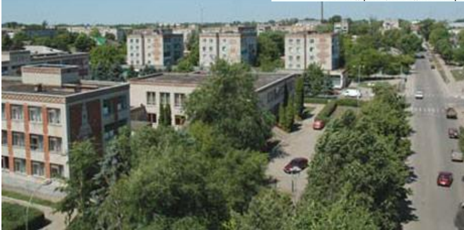
Станица Ленинградская (до 1934 года Уманская) с высоты птичьего полёта