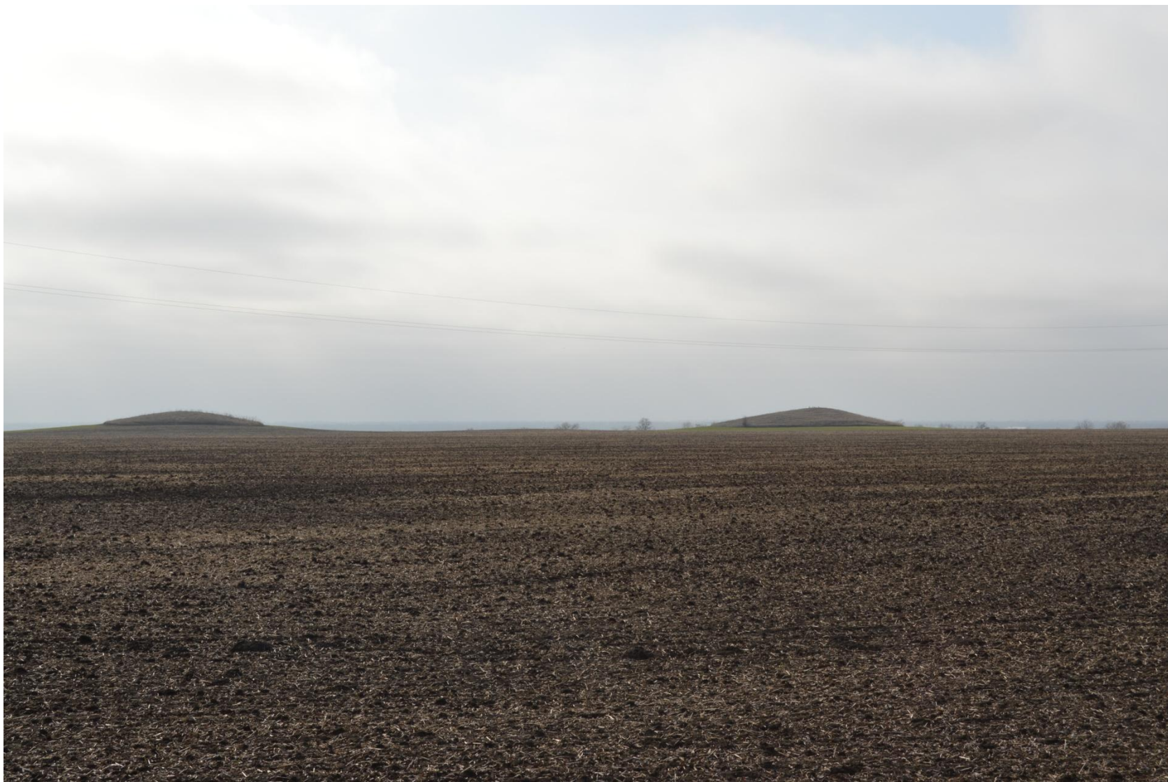
Немые свидетели далёких эпох – курганы Два брата в 1,5 км к западу от станции Ново-Платнировской