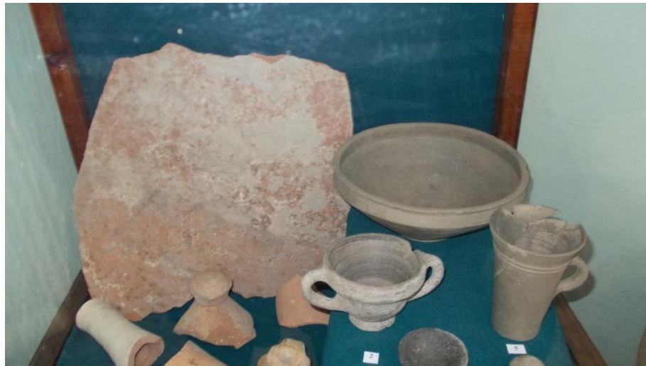
Находки из курганов в экспозиции Ленинградского историко-археологического музея