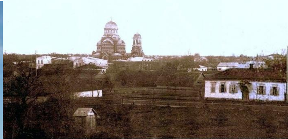
Уманская до революции 1917 года. Фото с северной стороны.