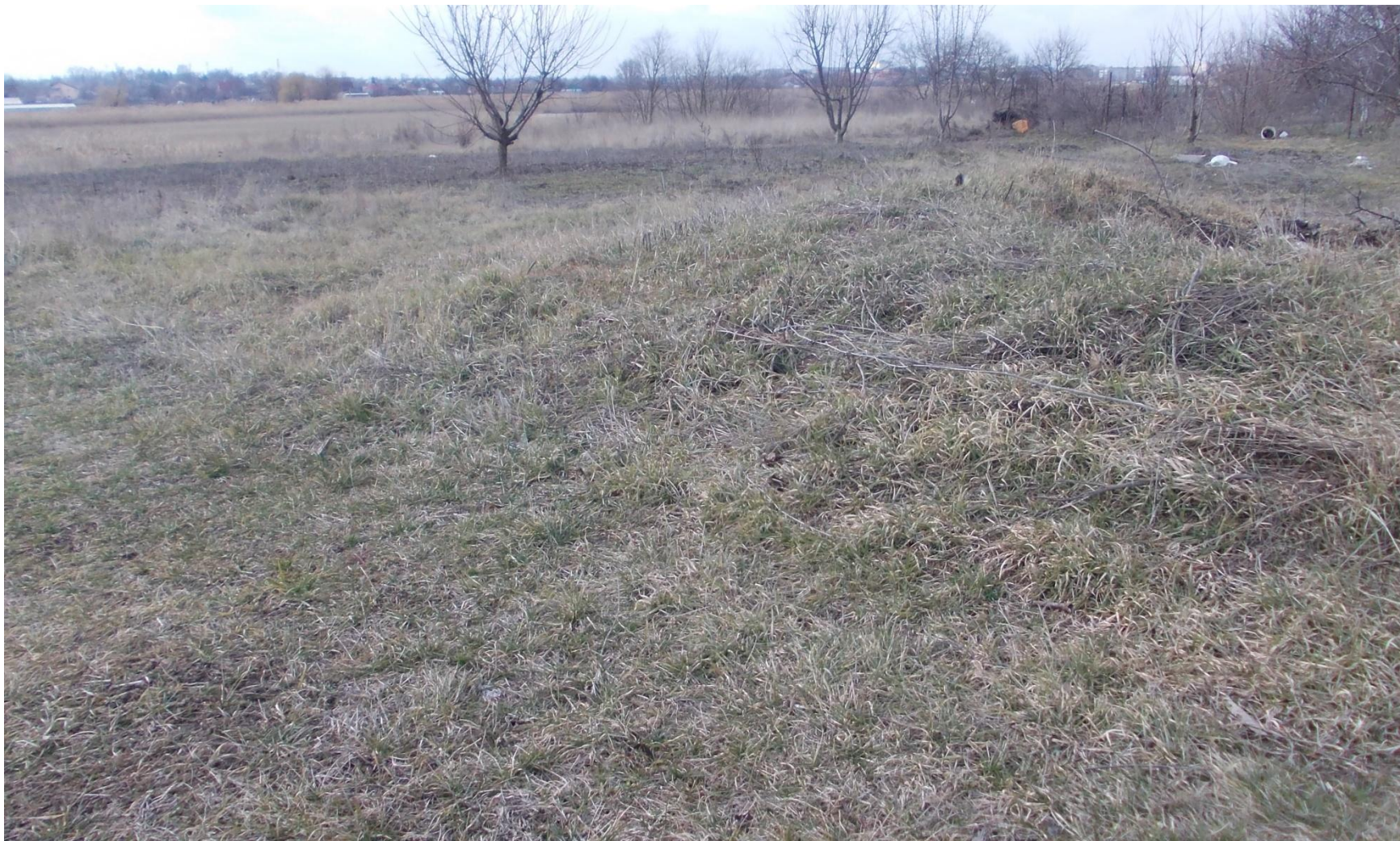
Курган на подворье Фирса Кузмича Куца (хутор Андрющенко Ленинградского района)