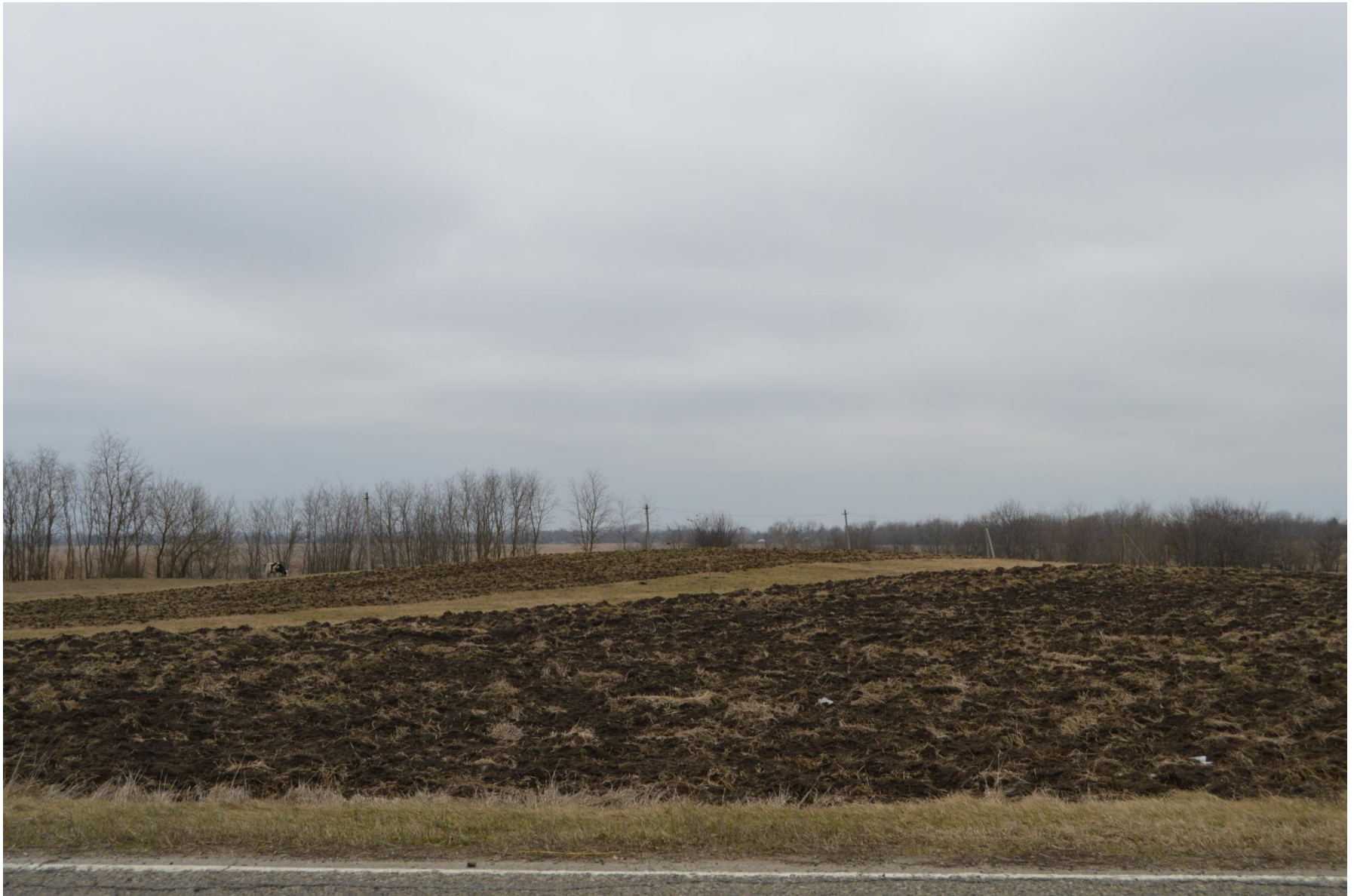
Курган Луцева могила на окраине станицы Крыловской