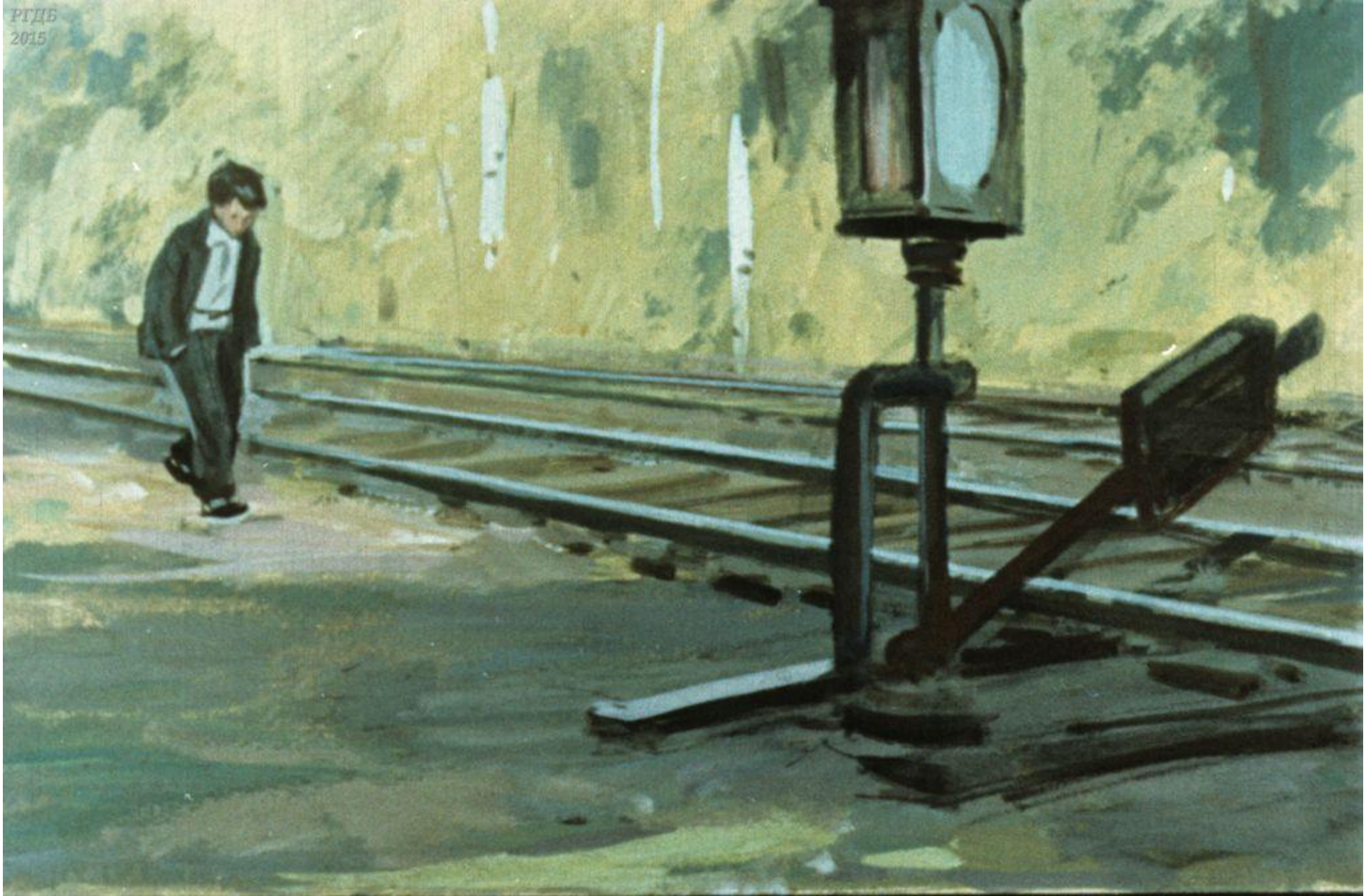
Возвращаться назад Петьке было и страшно и стыдно. Он чувствовал, что у него не хватит терпения смолчать о палатке. 28