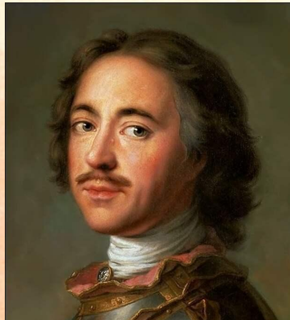
Император Петр I

Своими корнями история русской гвардии уходит в петровскую эпоху. В 1683 году 11-летний Петр I создал знаменитые потешные полки. Первым русским гвардейцем стал Сергей Леонтьевич Бухвостов – бывший царский конюх, который записался в потешный полк. В 1692 г. потешные солдаты Петра были, и разделены на два полка – Преображенский и Семёновский . В 1700 году потешным Преображенскому и Семеновскому полкам были присвоены названия лейб-гвардейских. Так в России появилась своя гвардия, которой было суждено играть важнейшую роль не только в военной, но и в политической