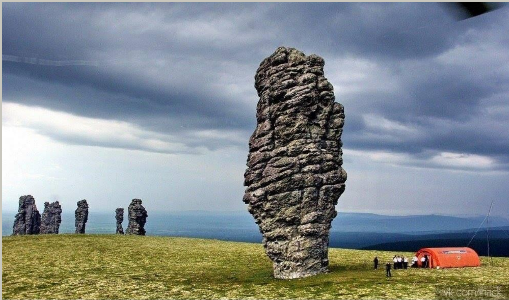
Столбы выветривания, Республика Коми