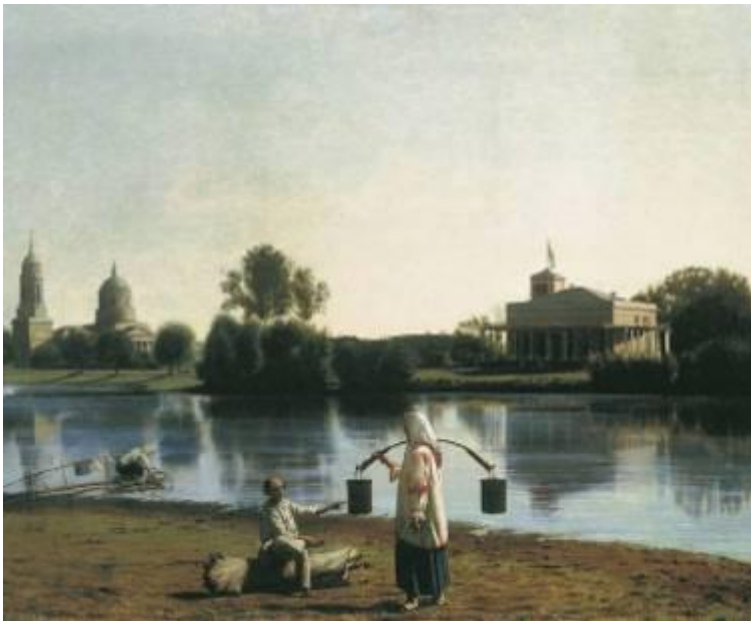
Художник Григорий Васильевич Сорока

Сельское хозяйство в 60—90-х годах развивалось довольно успешно.