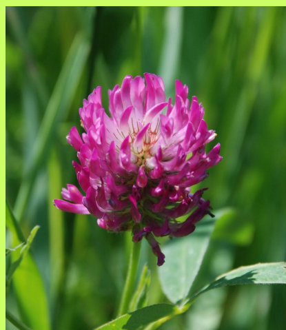
кашка - клевер